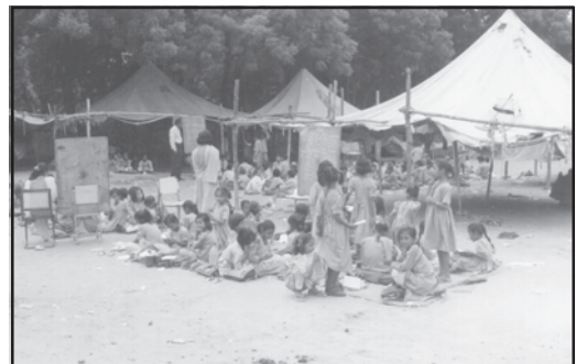
चित्रों की विवेचना करें (दो प्रकार के स्कूल)