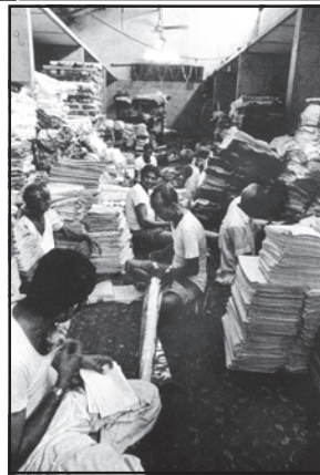
चित्रों के दो समुच्चयों में दिए गए उत्पादन के दो विभिन्न प्रकारों की चर्चा करें कारखाने में कपड़ा उत्पादन