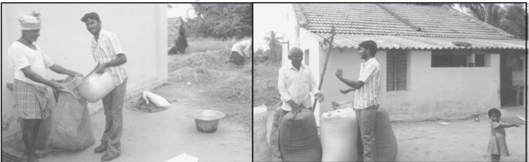
गाँव में धान की कटाई