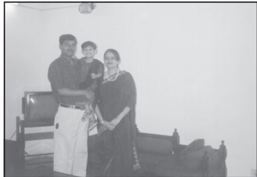
परिवारों और आवासों में अंतर पर ध्यान दीजिए