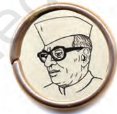
कन्हैयालाल माणिकलाल मुंशी

(1901-1961), जन्म: हरियाणा। सफल उद्यमी और पंजाब विधानसभा में पंथक अकाली पार्टी के नेता। संविधान सभा में कांग्रेस द्वारा मनोनीत। बाद में: केंद्रीय मंत्रिमंडल में रक्षा मंत्री।