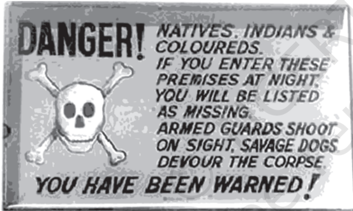
साउथ अफ्रीका हिस्ट्री ऑनलाइन

1950 से ही अश्वेत, रंगीन चमड़ी वाले और भारतीय मूल के लोगों ने रंगभेद प्रणाली के खिलाफ संघर्ष किया। उन्होंने विरोध प्रदर्शन किए और हड़तालें आयोजित कीं। भेदभाव वाली इस शासन प्रणाली का विरोध करने वाले संगठन अफ्रीकी नेशनल कांग्रेस के इंडे तले एकजुट