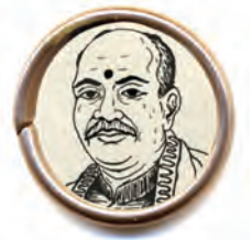
श्यामा प्रसाद मुखर्जी

(1887-1971), जन्म: गुजरात। वकील, इतिहासकार और भाषाविद्। कांग्रेसी नेता और गांधीवादी। बाद में: केंद्रीय मंत्रिमंडल में मंत्री। स्वतंत्र पार्टी के संस्थापक।