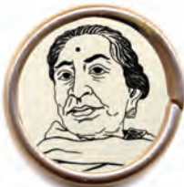
सरोजिनी नायडू (1879-1949) जन्म: आंध्र प्रदेश। कवयित्री, लेखिका और राजनैतिक कार्यकर्ता। कांग्रेस की अग्रणी महिला नेता। बाद में: उत्तर प्रदेश की राज्यपाल