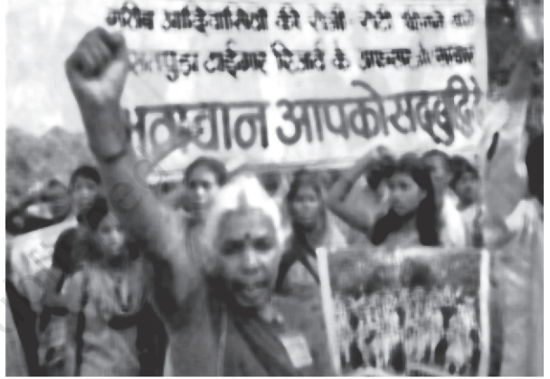
قبائلیوں کی جدوجہد جاری ہے

ملک بھر میں پھیلے مختلف قبائلی گروہوں کے مسائل یکساں ہو سکتے ہیں لیکن ان میں تفریق بھی اتنی ہی اہم ہے۔ قبائلی تحریکوں میں سے کئی زیادہ تروسطی ہندوستان کی نام نہاد قبائلی ہیلت میں واقع رہے ہیں۔ جیسے چھوٹا ناگپور و سنھال پرگنہ میں واقع سنھال، ہو، اوراوا منڈا۔ نئے بنے جھارکھنڈ ریاست کا خاص حصہ ان ہی پر مشتمل ہے۔ ہمارے لیے مختلف تحریکوں کے بارے میں تفصیلی گوشوارہ دینا ممکن نہیں۔ مثال کے طور پر جھارکھنڈ پر بحث کریں گے جہاں قبائلی تحریک کی تاریخ سو سال قدیم ہے۔ ہم مشرقی شمالی ریاستوں کی قبائلی تحریکوں کی خصوصیات کے بارے میں مختصر ابات کریں گے لیکن ان کی بھی تفصیل ممکن نہیں کیونکہ ایک ہی علاقے میں جھارکھنڈ قبائلی تحریک کی مختلف شکلیں موجود ہو سکتی ہیں۔