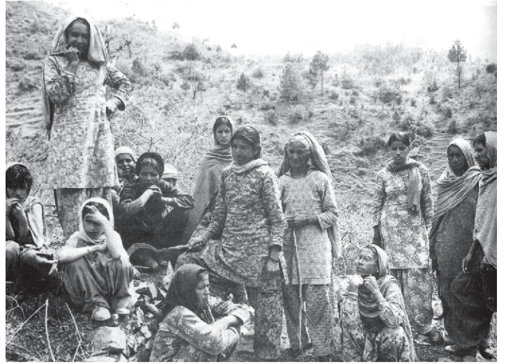
جنگلوں کی کٹائی پر بحث کرتے ہوئے لوگ، جونا گڈہ، ہماچل پردیش

ماحولیاتی تحفظ کے نتیجے میں علاقے میں تباہ کن سیلاب اور زمینوں کا دھنسا واقع ہوا۔ گاؤں والوں کے لیے لال اور ہرے مسائل ایک دوسرے سے وابستہ تھے جب کہ ان کی بقا جنگلوں کے باقی رہنے پر منحصر تھی۔ وہ جنگلوں کو سب کو فائدہ پہنچانے والی ماحولیاتی دولت کے طور پر بھی قدر کرتے تھے۔ اس کے ساتھ چپکو تحریک نے دور دراز کے میدانی علاقوں میں واقع حکومت کے ہیڈ کوارٹر جو ان کی متعلقہ تشویش کے تیس بے نیاز اور مخالف معلوم ہوتا تھا، کے خلاف پہاڑی گاؤں والوں کی ناراضگی کا بھی اظہار کیا۔ اس طرح معیشت، ماحولیاتی اور سیاسی نمائندگی کی فکر بھی چپکو تحریک کی بنیاد تھی۔ ماحول کی بہتری کے لیے درختوں کا ہونا ضروری ہے۔ یکساں طور پر صاف ستھرا ماحول، صاف پانی اور درگد صفائی پر محیط ہوتا ہے اور یہ اہم بھی ہے۔ ان تمام باتوں کو نظر میں رکھتے ہوئے حکومت ہند نے حال ہی میں ”انٹیگرٹڈ گنگا کنزرویشن مشن (Mission) (نما می گنگے، Intergrated Ganga Conservation)