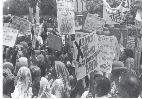
جہیز مخالف جدوجہد

اس بات کو تسلیم کیا جانے لگا ہے کہ سبھی عورتیں کسی نہ کسی طرح مردوں کے مقابلے میں سہولتوں سے زیادہ محروم ہیں لیکن یہ بھی صحیح ہے کہ سبھی عورتوں کے ساتھ ایک ہی قسم کا امتیاز نہیں ہوتا۔ تعلیم یافتہ عورتوں کی فکر کسان عورتوں سے اسی طرح مختلف ہے جس طرح ایک دلت عورت کی فکر ایک اعلیٰ ذات کی عورت سے۔ آئیے اس تشدد کی مثال دیکھیں۔