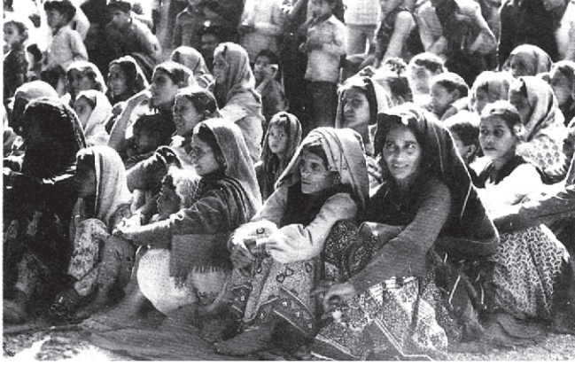
سکالانا میں عالمی یوم ماحولیات پر یکجا چپکو تحریک کار، 1986

اپنے علاقے میں ماحولیاتی آلودگی کی چند مثالوں کا پتہ لگائیے اور بحث کیجیے۔ آپ اپنی دریافت کی ہوئی مثالوں کی پوسٹر نمائش بھی لگا سکتے ہیں۔