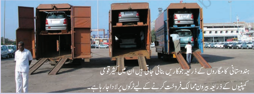
ہندوستانی کامگاروں کے ذریعے جو کاریں بنائی جاتی ہیں ان میں کثیر قومی کمپنیوں کے ذریعے بیرون ممالک فروخت کرنے کے لیے ٹرکوں پر لادا جا رہا ہے۔

ایک امریکی کمپنی فورڈ موٹرس دنیا کے بڑے آٹھ موبائل بنانے والوں میں سے ایک ہے جس کا پیداواری عمل دنیا کے 26 ملکوں میں پھیلا ہوا ہے۔ فورڈ موٹرس کی آمد ہندوستان میں 1995 میں ہوئی اور اس نے چنئی کے قریب ایک بڑا پلانٹ لگانے میں 1,700 کروڑ روپے خرچ کیے۔ یہ کام مہندرا اینڈ مہندرا (جیپوں اور ٹرکوں کے ایک بڑے مینیوفیکچرر) کے اشتراک سے انجام دیا گیا۔ 2017 تک فورڈ موٹرس ہندوستانی بازاروں میں 88,000 کاریں فروخت کر چکی تھی جب کہ 1,81,000 کاریں ہندوستان سے جنوبی افریقہ، میکسیکو، برازیل اور متحدہ ریاستہائے امریکہ کو برآمد کیا گیا کمپنی فورڈ انڈیا کو پوری دنیا میں اپنے دیگر پلانٹوں کے لیے جزو ترکیبی فراہمی بنیاد کے طور پر فروغ دینا چاہتی ہے۔