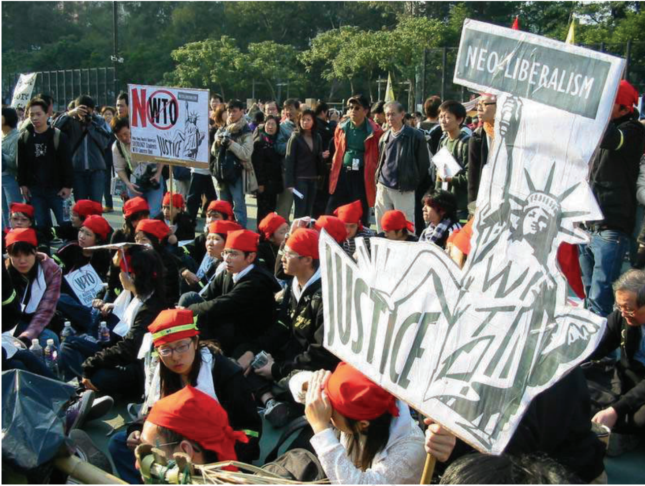
بانک کانگ میں 2005 میں ڈبلوٹی او کے خلاف مظاہرہ