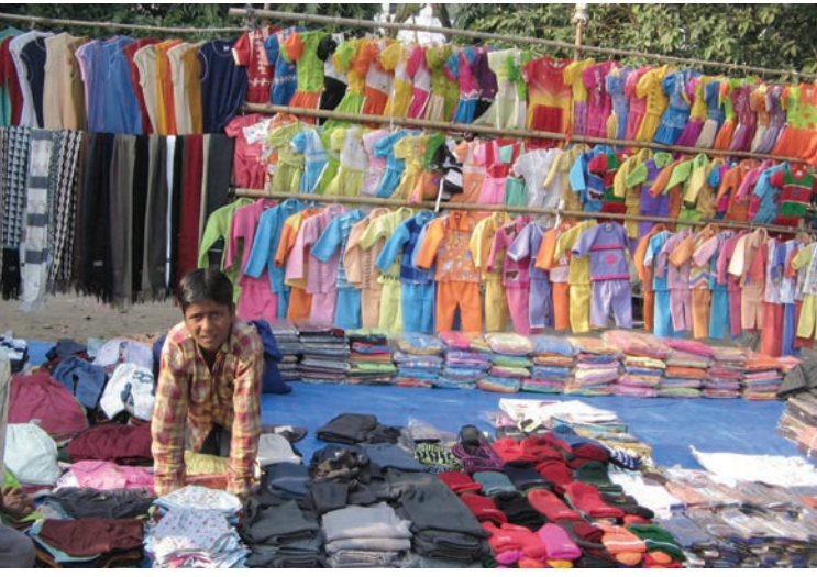
کثیرقومی برانڈوں اور درآمدات دونوں میں تیار ملبوسات کے چھوٹے تاجر تھت مسابقت کا سامنا کر رہے ہیں۔

بازاروں سے آگے پہنچنے کے لیے پیدا کاروں کے لیے ایک موقع کی تخلیق کرتی ہے۔ پیدا کار اپنی اشیا کو نہ صرف اپنے ملک کی بازار میں فروخت کر سکتے ہیں بلکہ دنیا کے دیگر ملکوں میں واقع بازاروں کے ساتھ مسابقت کر سکتے ہیں۔ اسی طرح خریداروں کے لیے دوسرے ملک میں تیار کی گئی اشیا کی درآمد گھریلو طور پر تیار اشیا سے باہر انتخاب کو وسعت دینے کا ایک طریقہ ہے۔