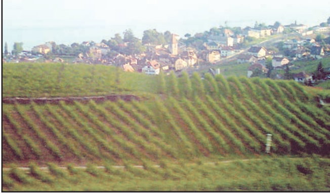
شکل 6.12: بحررومی خطے میں انگور کے باغ

آسٹریلیا میں بھی ملتی ہے۔ ان علاقوں میں خصوصاً گرم و خشک موسم گرما اور ہلکی بارش کا موسم سرما (سردی کا موسم) ہوتا ہے۔ ان علاقوں میں عام طور پر سنٹرا نیبو جیسے ریلے پھل (CITRUS FRUITS) انجیر، زیتون اور انگور وغیرہ پھلوں کی کاشت کی جاتی ہے کیونکہ لوگوں نے قدرتی نباتات کو صاف کر کے یہاں پر اپنی پسند کے مطابق کاشت شروع کی ہے۔ اس علاقے میں جنگلی جانوروں کی بہت کمی ہے۔