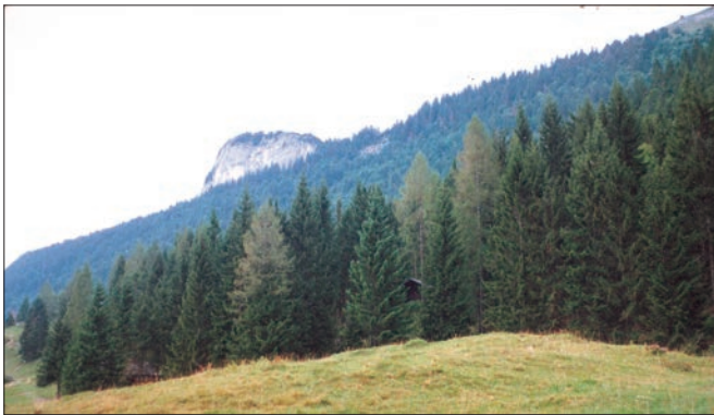
شکل 6.13 a: مخروطی جنگلات

شمالی نصف کرہ بالائی عرض البلد (50-70) میں یہ مخروطی جنگلات ملتے ہیں (تصویر 6.13) a&b جنگلات کو ٹیگا (TAIGA) بھی کہتے ہیں۔ یہ جنگلات سطح سمندر سے بہت زیادہ اونچائی والے علاقوں میں پائے جاتے ہیں۔ یہ نرم لکڑی والے سردا بہار جنگلات ہوتے ہیں۔ یہ درخت لگدی بنانے میں کام آتے ہیں جو کاغذ اور نیوز پرنٹ کاغذ یعنی اخبار کے کاغذ کے طور پر کام میں آتے ہیں۔ ماچس کی ڈبیاں اور سامان رکھنے کے ڈبے بھی ملائم لکڑی سے بنائے جاتے ہیں، 'چیٹر' دیودار اور 'سدرہ' یہاں کے اہم درخت ہیں یہاں پر عام طور پر