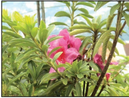
شکل 6.1: روڈو ڈینڈرون