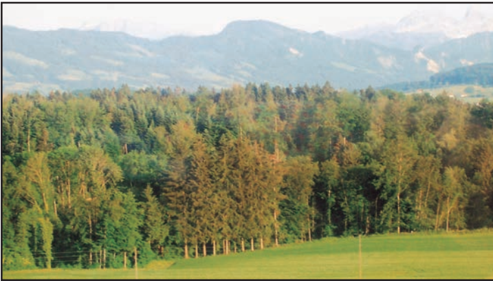
شکل 6.7: معتدل سدا بہار جنگلات

یہ سخت لکڑی والے درخت فرنیچر، ذرائع نقل و حمل اور عمارتی لکڑی کے طور پر بہت کام آتے ہیں۔ ان خطوں میں عام طور پر شیر، بر شیر، ہاگھی، لنگور اور بندر وغیرہ جانور ملتے ہیں۔