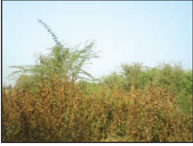
شکل 6.2: کانٹے دار جھاڑیاں