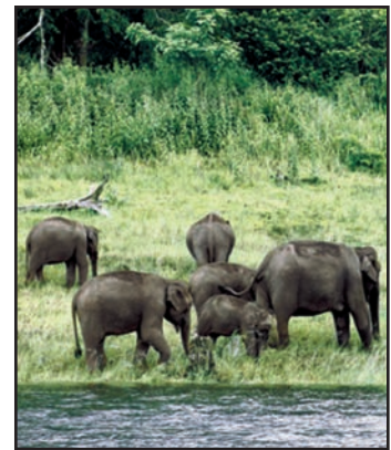
شکل 6.8: ہاتھی