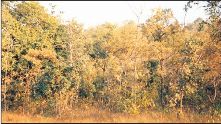
شکل 6.4: ٹراپکی پت جھڑ جنگل

یہ سخت لکڑی والے درخت فرنیچر، ذرائع نقل و حمل اور عمارتی لکڑی کے طور پر بہت کام آتے ہیں۔ ان خطوں میں عام طور پر شیر، بر شیر، ہاگھی، لنگور اور بندر وغیرہ جانور ملتے ہیں۔