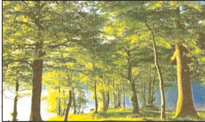
شکل 6.11: معتدل پت جھڑ والے جنگلات

جوں جوں ہم زیادہ بلند عرض البلد کی طرف جاتے ہیں ہمیں معتدل پت جھڑ والے جنگلات کی زیادہ تعداد ملتی ہے۔ یہ ریاست ہائے متحدہ امریکا ملتے ہیں اس کے علاوہ مغربی یورپ کے ساحلی علاقوں میں بھی یہ جنگلات پائے جاتے ہیں۔ یہ اپنی پتیاں خشک موسم میں گرا دیتے ہیں۔ یہاں پر عام طور پر شاہ بلوط، ایش اور بیچ (سفیدے کی قسم کا اونچا درخت) وغیرہ درخت پائے جاتے ہیں۔ ہرن، لومڑی، بھیڑیے وغیرہ جانور یہاں عام طور پر ملتے ہیں، پرندوں میں مختلف قسم کے تیتیر (PHEASANT) کی نسل کے پرندے، اور مونال یہاں پائے جاتے ہیں۔