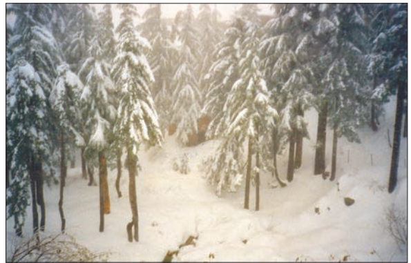
شکل 6.13 b: برف سے ڈھلے مخروطی طبی جنگلات