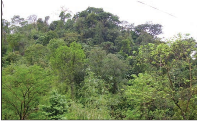
شکل 6.3: ٹراپکی سدا بہار جنگل

علاقوں میں بھی ملتے ہیں (تصویر 6.4) ان حصوں میں موسمی تبدیلیاں ہوتی رہتی ہیں۔ خشک موسم میں نمی کو محفوظ رکھنے کے لیے درخت اپنی پتیاں گرا دیتے ہیں۔ ان جنگلات میں سخت لکڑی کے درخت، سال، ساگوان، نیم اور شیشم ہیں۔