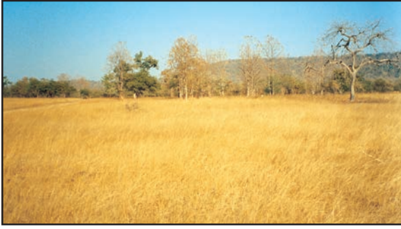
شکل 6.14: ٹراپیکل گھاس کے میدان