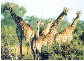
شکل 6.15: جیراف

روپہلی لومڑی (SILVER FOX) مینک قطبی بھالو جیسے جانور پائے جاتے ہیں۔