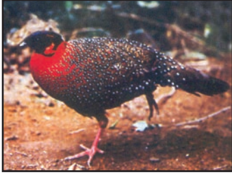
شکل 6.9: کالا تیتیر