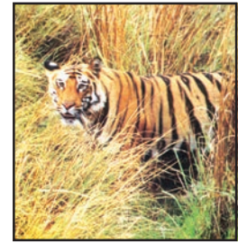
شکل 6.5: چیتا