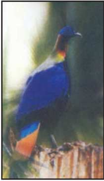
شکل 6.10: مونال