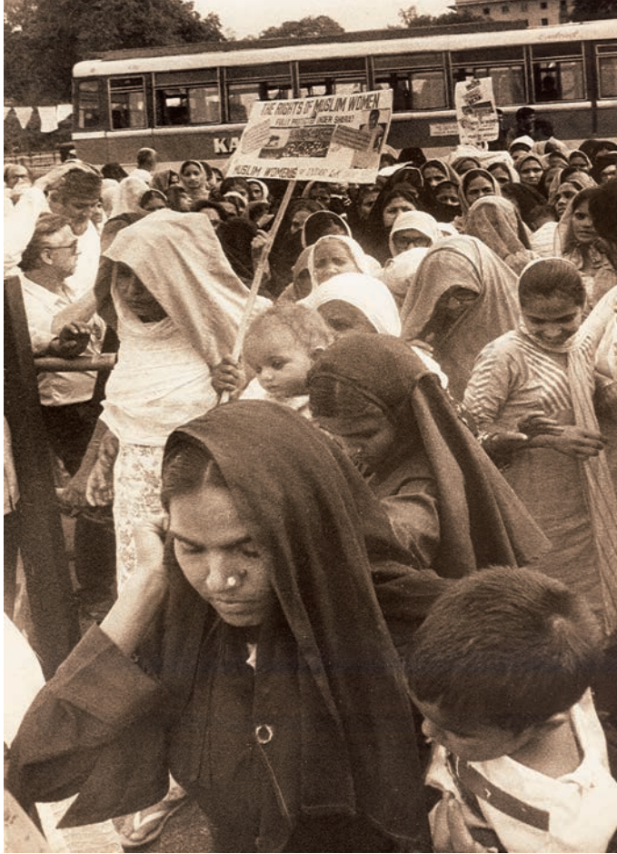
خواتین ایک جلوس میں اپنے حقوق کی مانگ کرتی ہوئیں

لہذا ان قائدین نے آئین کے تخیل اور مقاصد کو اس انداز سے پیش کیا کہ اس بات کو یقینی بنایا جائے کہ ہندوستان کے تمام لوگ برابر سمجھے جائیں۔ تمام لوگوں کی اس برابری یا مساوات کو ایسی کلیدی قدر کے طور پر دیکھا جاتا ہے جو ہم سب کو ہندوستانی شہری کی حیثیت سے متحد کرتی ہے۔ ہر شخص کو برابر کے حقوق اور مواقع حاصل ہیں۔ چھوٹ چھات کو ایک جرم سمجھا گیا ہے اور اسے قانونی طور پر