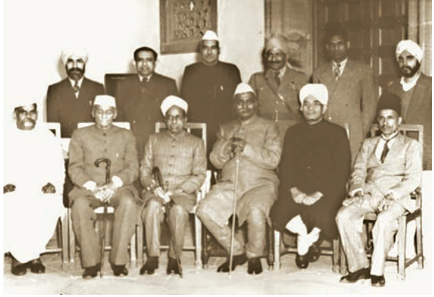
ہندوستان کے آئین کو لکھنے والے کچھ اراکین

حالانکہ یہ اعلیٰ مقاصد ہمارے آئین میں محفوظ ہیں، تاہم عدم مساوات آج بھی پائی جاتی ہے جیسا کہ اس باب میں بیان کیا گیا ہے۔ مساوات یا برابری ایسی قدر ہے جس کے لیے ہمیں جدوجہد اور کوشش جاری رکھنی ہوگی۔ یہ ایسی چیز نہیں ہے جو خود بخود آجائے گی۔ لوگوں کی جدوجہد اور حکومت کی جانب سے مثبت عملی کام اسے تمام ہندوستانیوں کے لیے ایک حقیقت بنانے کے واسطے ضروری ہیں۔