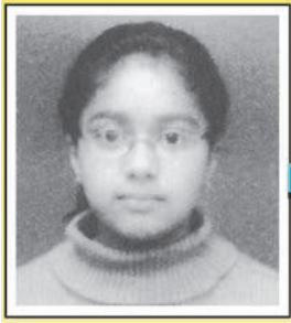
اپرنا سنہا جماعت IX

میں مشرقی گھاٹ سرحد کا کام کرتے ہیں۔ مشرقی گھاٹ غیر سلسلے وار اور ٹوٹے پھوٹے ہیں جبکہ مغربی گھاٹ تقریباً سلسلے وار ہیں (شکل 7.3)۔ یہ پٹھار معدنی دولت جیسے کونکہ اور کچے لوہے سے مالا مال ہیں۔