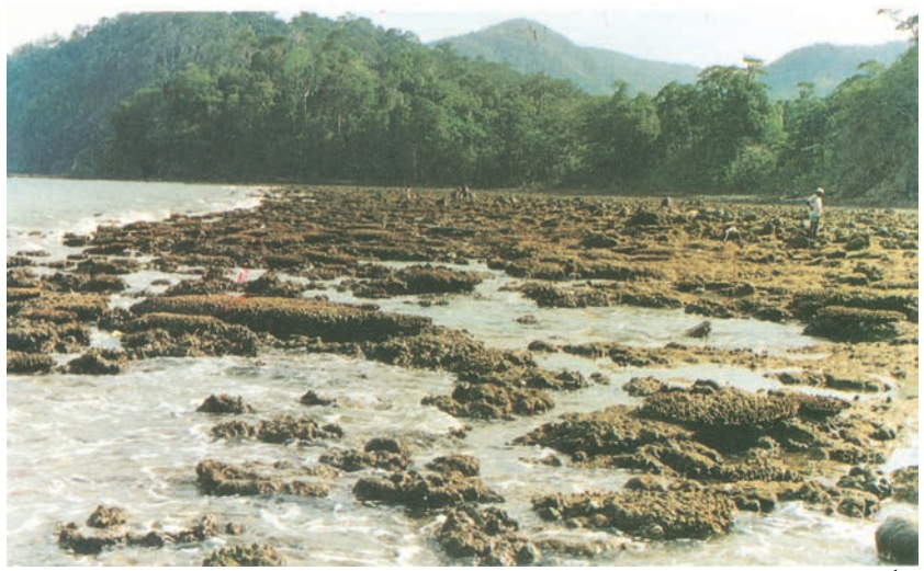
شکل 7.4: مرجانی جزیرہ

میں مشرقی گھاٹ سرحد کا کام کرتے ہیں۔ مشرقی گھاٹ غیر سلسلے وار اور ٹوٹے پھوٹے ہیں جبکہ مغربی گھاٹ تقریباً سلسلے وار ہیں (شکل 7.3)۔ یہ پٹھار معدنی دولت جیسے کونکہ اور کچے لوہے سے مالا مال ہیں۔