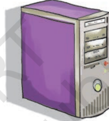
سی۔ پی۔ یو۔