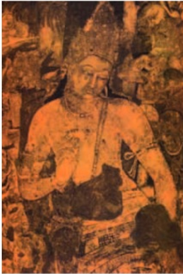
अजंता का एक चित्र

अजंता हमें किसी स्वप्न की तरह दूर किंतु असल में एकदम वास्तविक दुनिया में ले जाती है। इन भित्ति चित्रों को बौद्ध भिक्षुओं ने बनाया था। बहुत समय पहले उनके स्वामी ने कहा था स्त्रियों से दूर रहें, उनकी तरफ़ देखो भी नहीं, क्योंकि वे खतरनाक हैं। इसके बावजूद इन चित्रों में स्त्रियों की कमी नहीं है-सुंदर स्त्रियाँ, राजकुमारियाँ, गायिकाएँ, नर्तकियाँ, बैठी और खड़ी, शृंगारकरती हुई या शोभा यात्रा में जाती हुई। ये चित्रकार भिक्षु सेसार को और जीवन के गतिशील नाटक को कितनी अच्छी तरह जानते थे। उन्होंने ये चित्र उतने ही प्रेम से बनाए हैं जितने प्रेम से उन्होंने बोधिसत्व को उनकी शांत, लोकोत्तर गरिमा में चित्रित किया है।