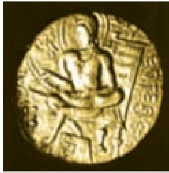
समुद्रगुप्त वीणा बजाते हुए—एक सिक्का

कर सकता था क्योंकि इन्होंने केवल उसके राजनीतिक ढाँचे को ही नहीं तोड़ा बल्कि उसके सांस्कृतिक आदर्शों और सामाजिक ढाँचे के लिए भी खतरा पैदा कर दिया। इनके विरुद्ध जो प्रतिक्रिया हुई उसका रूप मूलतः राष्ट्रवादी था। उसमें राष्ट्रवाद की शक्ति भी थी और सेकीर्णता भी। धर्म और दर्शन, इतिहास और परंपरा, रीति-रिवाज और सामाजिक ढाँचा, जिसके व्यापक घेरे में उस समय के भारत के जीवन के सभी पहलू आते थे, जिसे ब्राह्मणवाद या हिंदूवाद कहा गया, वह इस राष्ट्रवाद का प्रतीक बना। यह दरअसल राष्ट्रीय धर्म था, जिससे वे तमाम गहरी जातीय और सांस्कृतिक प्रवृत्तियाँ प्रभावित हुईं जो आज हर जगह राष्ट्रीयता की बुनियाद में मौजूद हैं। जिस बौद्ध धर्म का जन्म भारतीय विचार से हुआ था, उसके लिए भारत वह पुण्य भूमि थी जहाँ बुद्ध ने जन्म लिया, उपदेश दिया और वहीं उनका निर्वाण हुआ। पर बौद्ध धर्म मूल रूप में अंतरराष्ट्रीय था, विश्वधर्म था। जैसे-जैसे उनका विकास और विस्तार हुआ वैसे-वैसे उसका यह रूप और विकसित होता गया। इसलिए पुराने ब्राह्मण धर्म के लिए स्वाभाविक था कि वह बार-बार राष्ट्रीय पुनर्जागरण का प्रतीक बने।