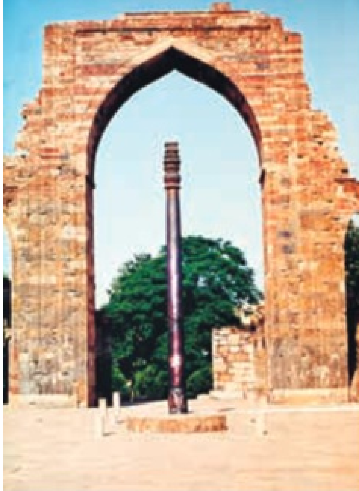
महरौली (दिल्ली) में कुतुबमीनार के परिसर में खड़ा लौह-स्तंभ, जिसका निर्माण लगभग 1500 साल पहले हुआ

प्राचीन काल से ही फ़ौलाद को ताव देना जानते थे। भारतीय फ़ौलाद और लोहों की दूसरे देशों में बहुत कद्र की जाती थी, विशेष रूप से युद्ध के कामों में। भारतीयों को और बहुत-सी धातुओं की भी जानकारी थी और उनका इस्तेमाल किया जाता था। औषधियों के लिए धातुओं के मिश्रण तैयार किए जाते थे। आसव और भस्म बनाना ये लोग खूब जानते थे। औषध-विज्ञान काफ़ी विकसित था। मध्य युग तक प्रयोगों में काफ़ी विकास किया जा चुका था, गरचे ये प्रयोग मुख्य रूप से प्राचीन ग्रंथों पर आधारित थे। शरीर-रचना और शरीर-विज्ञान का अध्ययन किया जाता था और हार्वे से बहुत पहले रक्त-संचार की बात सुझाई जा चुकी थी।