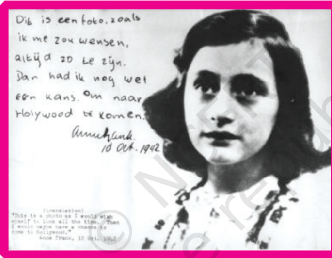
ऐन फ्रैंक की डायरी का एक पन्ना

रात को जब मैं बिस्तर पर होती हूँ तो अपने पापों और बढ़ा-चढ़ाकर बताई गई अपनी खामियों के बारे में सोचती हूँ तो वे इतनी ज़्यादा होती हैं कि अपने मूड के हिसाब से या तो मैं