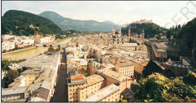
चित्र 7.2 : सघन बस्ती