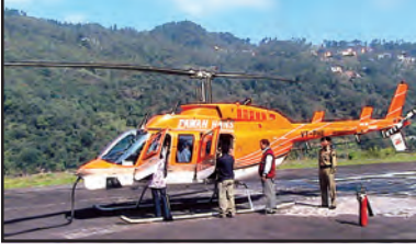
चित्र 7.9 : हेलीकॉप्टर

बीसवीं सदी के आरंभ में विकसित यह परिवहन का सबसे तीव्र मार्ग है। ईंधन की लागत अधिक होने के कारण यह सर्वाधिक महंगा साधन है। वायु यातायात खराब मौसम, जैसे-कुहरे एवं तूफान से कुप्रभावित होता है। यह यातायात का अकेला साधन है, जो सर्वाधिक दुर्गम एवं दुरूह स्थानों तक पहुँच सकता है, विशेष रूप से जहाँ सड़क एवं रेलमार्ग नहीं हैं। हेलीकॉप्टर अगम्य स्थानों एवं संकटकालीन स्थितियों में लोगों को बचाने एवं भोजन, जल, कपड़े एवं दवाएँ बाँटने के लिए एक बहुत ही उपयोगी साधन है (चित्र 7.9)। कुछ महत्वपूर्ण हवाई पत्तन हैं : दिल्ली, मुंबई, न्यूयॉर्क, लंदन, पेरिस, फ्रैंकफर्ट एवं काहिरा (चित्र 7.11)।