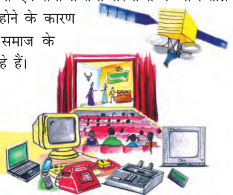
चित्र 7.10 : संचार माध्यमों का विकास