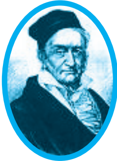
کارل فریڈرک گاس (1777-1855)

عمومی طور پر ایک دیے ہوئے مرکب عدد x کے ہم اجزائے ضربی معلوم کرتے ہیں x = p_1 p_2 \dots p_n ، جہاں p_1, p_2, \dots, p_n