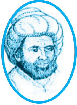
محمد ابن موسیٰ الخوارزمی (C.E. 780 - 850)

اس نتیجہ کا انکشاف بہت پہلے ہو چکا تھا۔ لیکن سب سے پہلے اس کو اقلیدس کے عناصر کی کتاب VII میں ریکارڈ کیا گیا، اقلیدس کے تقسیم کا الگورتھم کی بنیاد اس معاونہ پر ہے۔