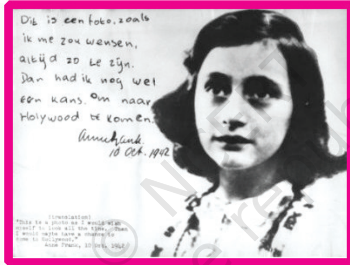
ऐन फ्रैंक की डायरी का एक पन्ना

मेरी प्यारी किट्टी, अब मैं तुम्हें कितना उलझा रही हूँ। लेकिन मैं चीज़ें एक बार लिखकर उन्हें काटना पसंद नहीं करती