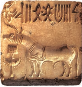
एक हड़प्पाई मुहर

भारत के अतीत की सबसे पहली तसवीर उस सिंधु घाटी सभ्यता में मिलती है, जिसके अवशेष सिंध में मोहनजोदड़ो और पश्चिमी पंजाब में हड़प्पा में मिले हैं। इन खुदाइयों ने प्राचीन इतिहास की समझ में क्रांति ला दी है।