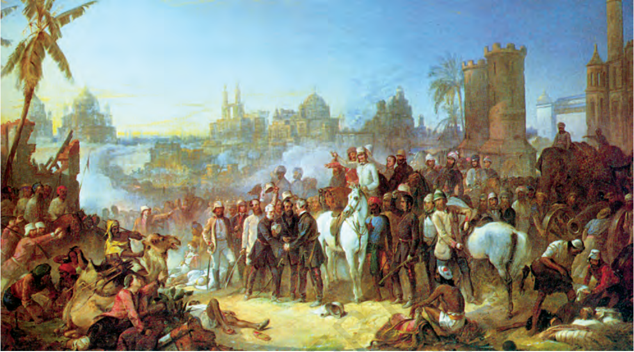
चित्र 11.10 “द रिलीफ ऑफ लखनऊ” चित्रकार टॉमस जोन्स बार्कर, 1859

विद्रोही टुकड़ियों ने लखनऊ पर घेरा डाल दिया तो लखनऊ के कमिश्नर हेनरी लॉरेंस ने ईसाइयों को इकट्ठा किया और बेहद सुरक्षित रेजीडेंसी में पनाह ले ली। बाद में लॉरेंस तो मारा गया किंतु कर्नल इंगलिस के नेतृत्व में रेजीडेंसी सुरक्षित रहा। 25 सितंबर को जेम्स ऑट्रम और हेनरी हेवलॉक वहाँ पहुँचे, उन्होंने विद्रोहियों को तितर-बितर कर दिया और ब्रिटिश टुकड़ियों को नयी मजबूती दी। 20 दिन बाद भारत में ब्रिटिश टुकड़ियों का नया कमांडर कॉलिन कैम्पबेल भारी तादाद में सेना लेकर वहाँ पहुँचा और उसने ब्रिटिश रक्षकसेना को घेरे से छुड़ाया। अंग्रेजों के बयानों में लखनऊ की घेरेबंदी उत्तरजीविता, बहादुराना प्रतिरोध और ब्रिटिश सत्ता की निर्विवाद विजय की कहानी बन गई।