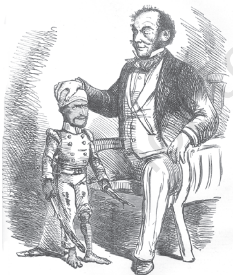
THE CLEMENCY OF CANNING.

हास्यपरक व्यंग्य की ब्रिटिश पत्रिका पन्च के पन्नों में प्रकाशित एक कार्टून में कैनिंग को एक भव्य नेक बुजुर्ग के रूप में दर्शाया गया। उसका