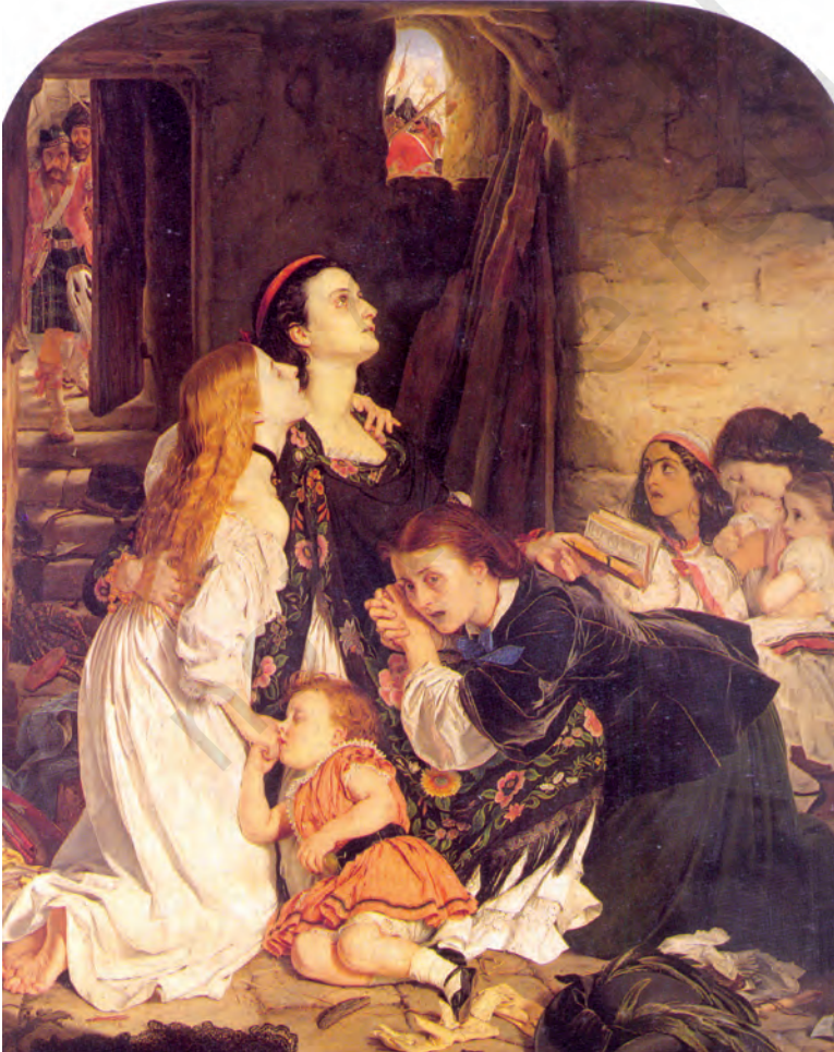
चित्र 11.11 “इन मेमोरियम”, चित्रकार जोज़ेफ़ नोएल पेटन, 1859

जोज़ेफ़ नोएल पेटन ने सैनिक विद्रोह के दो साल बाद “इन मेमोरियम” (‘स्मृति में’, चित्र 11.11) बनाई। इस चित्र में अंग्रेज़ औरतें और बच्चे एक घेरे में एक-दूसरे से लिपटे दिखाई देते हैं। वे लाचार और मासूम दिख रहे हैं, मानो एक भयानक घड़ी की आंशका में हैं।