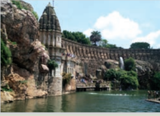
شکل 4- بی۔ چٹوڑ گڑھ کا قلعہ، راجستھان

بہت سے راجپوت سرداروں نے پہاڑوں کی چوٹیوں پر قلعے تعمیر کرائے جو اقتدار کا مرکز بن گئے تھے۔ وسیع فیصل بندی کے ساتھ ان شاندار قلعوں میں شہری مراکز، محلات، مندر، تجارتی مراکز، پانی ذخیرہ کرنے کے لیے تالاب وغیرہ اور دیگر عمارتیں بنوائی گئی تھیں۔ چٹوڑ گڑھ کے قلعے میں تالابوں کنڈوں (کنوؤں)، باؤلیوں وغیرہ پانی کے بہت سے ذرائع موجود تھے۔