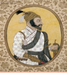
شکل 7-اے شیواجی کی پورٹریٹ

کچھ قابل رہنماؤں کی قیادت میں، سکھوں نے اٹھارھویں صدی کے دوران خود کو بہت سے فوجی ٹولوں کے روپ میں منظم کیا جنھیں 'جتھا' کہا جاتا تھا اور بعد میں 'مثل'۔ ان کی ملی جلی فوجی طاقتوں کو عالی شان فوج (دل خالصہ) کہا جاتا تھا۔ یہ تمام گروہ بیساکھی اور دیوالی پر امرتسر میں جمع ہوتے تھے اور اجتماعی فیصلے کرتے تھے جنھیں 'گرو کے فیصلے'، 'گور ماتا' کہا جاتا تھا۔ ایک نظام 'راکھی' کے نام سے شروع کیا گیا جس کے تحت کسانوں سے ان کی پیداوار کا 20 فیصد حصہ لے کر انھیں تحفظ دیا جاتا تھا۔