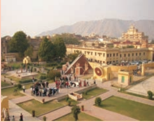
شکل 4 سی جنر منتر، بے پور

کی صوبے داری دے دی گئی۔ راجستھان کے علاقوں میں 1740 کے بعد سے مراٹھا مہموں نے ان سرداری ریاستوں پر زبردست دباؤ ڈالا اور انھیں آگے بڑھنے سے روک رکھا۔