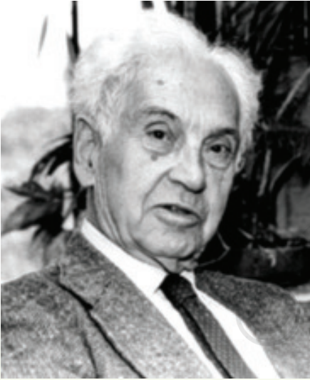
एरनस्ट मेयर (1904 - 2004)

एरनस्ट मेयर का जन्म 5 जुलाई, 1904 में केंपटन, जर्मनी में हुआ था। आप हावर्ड विश्वविद्यालय के विकासपरक जीव वैज्ञानिक थे, जिन्हें '20वीं शती का डार्विन' कहा गया। आप अब तक के 100 महान वैज्ञानिकों में से एक थे। मेयर ने सन् 1953 में हावर्ड विश्वविद्यालय की कला एवं विज्ञान संकाय में नौकरी प्राप्त की और 1975 में एलेक्जेंडर अगासीज प्रोफेसर ऑफ जुलोजी एमीरिटस की पदवी के साथ अवकाश प्राप्त किया। अपने 80 सालों के कार्य जीवन में आपका पक्षी-विज्ञान, वर्गीकरण-विज्ञान, प्राणि-भूगोल, विकास, वर्गिकी तथा जीव विज्ञान के इतिहास एवं दर्शन आदि पर अनुसंधान केंद्रित रहा। आप ने लगभग अकेले ही विकासीय जीव विज्ञान के केंद्रीय प्रश्न जाति विविधता की उत्पत्ति को खड़ा किया, जो कि आज सच है। इसके साथ ही आपने हाल ही में स्वीकृत जीव वैज्ञानिक जाति वर्गिकी की परिभाषा की अगुवाई की। मेयर को तीन पुरस्कार दिए गए, जिन्हें व्यापक तौर पर जीव विज्ञान के तीन ताजों की संज्ञा दी जाती है: 1983 में बालजॉन प्राइज, 1998 में जीव विज्ञान के लिए इंटरनेशनल प्राइज और 1999 में क्राफर्ड प्राइज। मेयर ने 100 वर्ष की आयु में 2004 को स्वर्गवासी हुए।