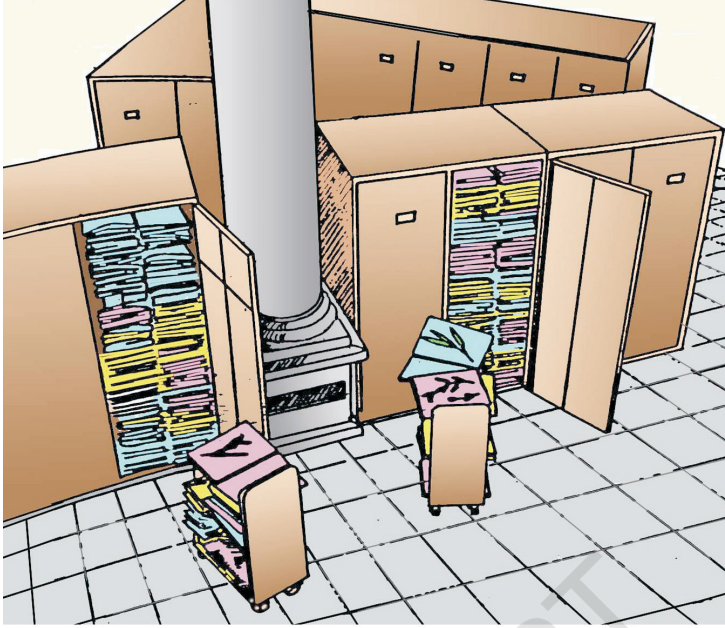
चित्र 1.2 वनस्पति संग्रहालय में पौधों के एकत्रित नमूने