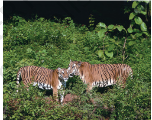
चित्र 1.3 भारत के विभिन्न चिड़ियाघरों में वन्य प्राणी