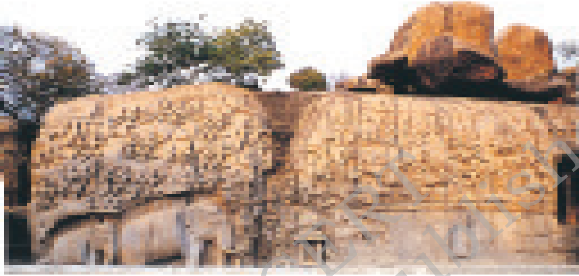
महाबलीपुरम् की एक इमारत

एलिफेंटा की गुफाओं में नटराज शिव की एक खंडित मूर्ति है, जिसमें शिव नृत्य की मुद्रा में हैं। हैवेल का कहना है कि इस क्षत-विक्षत अवस्था में भी यह मूर्ति भीमाकार शक्ति का मूर्त रूप है और इसकी कल्पना अत्यंत विशाल है।