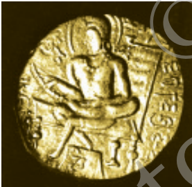
समुद्रगुप्त वीणा बजाते हुए—एक सिक्का

नहीं तोड़ा बल्कि उसके सांस्कृतिक आदर्शों और सामाजिक ढाँचे के लिए भी खतरा पैदा कर दिया। इनके विरुद्ध जो प्रतिक्रिया हुई उसका रूप मूलतः राष्ट्रवादी था। उसमें राष्ट्रवाद की शक्ति भी थी और संकीर्णता भी। धर्म और दर्शन, इतिहास और परंपरा, रीति-रिवाज और सामाजिक ढाँचा, जिसके व्यापक घेरे में उस समय के भारत के जीवन के सभी पहलू आते थे, जिसे ब्राह्मणवाद या हिंदूवाद कहा गया, वह इस राष्ट्रवाद का प्रतीक बना। यह दरअसल राष्ट्रीय धर्म था, जिससे वे तमाम गहरी जातीय और सांस्कृतिक प्रवृत्तियाँ प्रभावित हुईं जो आज हर जगह राष्ट्रीयता की बुनियाद में मौजूद हैं। जिस बौद्ध धर्म का जन्म भारतीय विचार से हुआ था, उसके लिए भारत वह पुण्य भूमि थी जहाँ बुद्ध ने जन्म लिया, उपदेश दिया और वहीं उनका निर्वाण हुआ। पर बौद्ध धर्म मूल रूप में अंतरराष्ट्रीय था, विश्वधर्म था। जैसे-जैसे उसका विकास और विस्तार हुआ वैसे-वैसे उसका यह रूप और विकसित होता गया। इसलिए पुराने ब्राह्मण धर्म के लिए स्वाभाविक था कि वह बार-बार राष्ट्रीय पुनर्जागरण का प्रतीक बने।