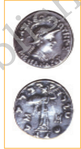
हिंद-यूनानी शासक मेनांडर का एक सिक्का

मौर्य साम्राज्य का अवसान हुआ और उसकी जगह शुंग वंश ने ले ली जिसका शासन अपेक्षाकृत बहुत छोटे क्षेत्र पर था। दक्षिण में बड़े राज्य उभर रहे थे और उत्तर में काबुल से पंजाब तक बाख्त्री या भारतीय-यूनानी फैल गए थे। मेनांडर के नेतृत्व में उन्होंने पाटलीपुत्र तक पर हमला किया किंतु उनकी हार हुई। खुद मेनांडर पर भारतीय चेतना और वातावरण का प्रभाव पड़ा और वह बौद्ध हो गया। वह राजा मिलिंद के नाम से प्रसिद्ध हुआ। बौद्ध आख्यानों में उसकी लोक-प्रसिद्धि लगभग एक संत के रूप में हुई। भारतीय और यूनानी संस्कृतियों के मेल से अफ़गानिस्तान और सरहदी सूबे के क्षेत्र में गांधार की यूनानी-बौद्ध कला का जन्म हुआ।