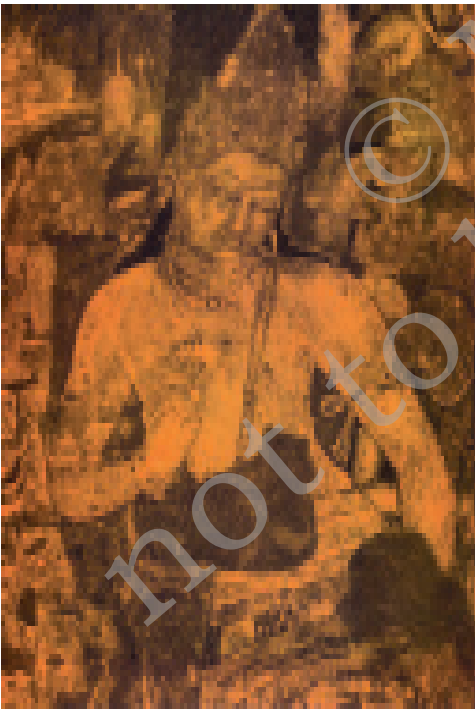
अजंता का एक चित्र

सातवीं-आठवीं शताब्दियों में ठोस चट्टान को काटकर एलोरा की विशाल गुफाएँ तैयार हुईं, जिनके बीच में कैलाश का विशाल मंदिर है। यह अनुमान करना कठिन है कि इंसान ने इसकी कल्पना कैसे की होगी या कल्पना करने के बाद अपनी कल्पना को रूपाकार कैसे दिया होगा। एलीफेंटा की गुफाएँ भी इसी समय की हैं जहाँ प्रभावशाली और रहस्यमयी त्रिमूर्ति बनी है। दक्षिण भारत में महाबलीपुरम् की इमारतों का निर्माण भी इसी समय हुआ था।