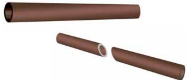
चित्र 4.3 धातुओं के टुकड़ों को उनकी द्युति देखने के लिए काटना

क्या आप अन्य पदार्थों में इसी प्रकार की कोई चमक अथवा द्युति देखते हैं? जैसे भी संभव हो सके किसी भी ढंग से इन्हें काटिए, ऐसा आप कक्षा में जितने भी पदार्थों के साथ कर सकते हैं,