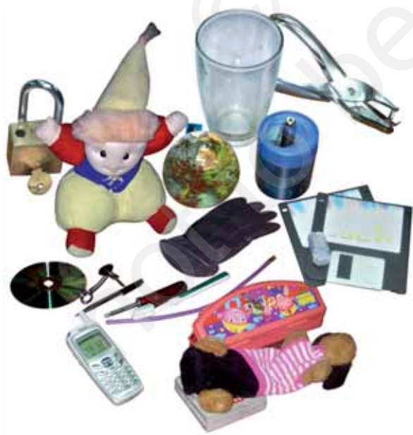
चित्र 4.1 हमारे चारों ओर की वस्तुएँ

अपने चारों ओर देखिए तथा गोल आकृति की वस्तुएँ पहचानिए। हमारी इस सूची में विभिन्न प्रकार की गेंद, जैसे रबड़ की गेंद, फुटबॉल तथा कंचे सम्मिलित हो सकते हैं। यदि हम अपनी सूची में लगभग गोल वस्तुओं को भी सम्मिलित कर लें तो इस में सेब, संतरे तथा घड़े जैसी वस्तुओं को भी रखा जा सकता है। मान लीजिए, हम ऐसी वस्तुओं पर ध्यान दे