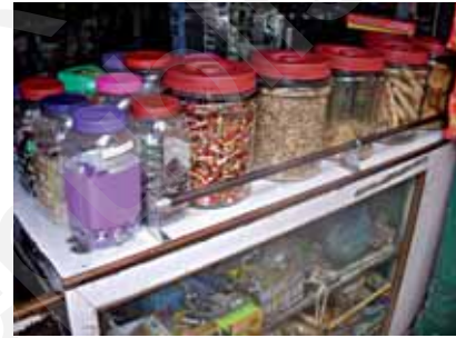
चित्र 4.8 दुकान में रखी पारदर्शी बोटलें

इसके विपरीत, कुछ ऐसे पदार्थ भी हैं जिनसे होकर आप वस्तुओं को नहीं देख सकते। इन पदार्थों को अपारदर्शी कहते हैं। आप यह नहीं बता सकते कि बंद लकड़ी के बॉक्स, गत्ते के डिब्बे अथवा धातु के पात्र के भीतर क्या रखा है? लकड़ी, गत्ता तथा धातुएँ अपारदर्शी पदार्थों के उदाहरण हैं।