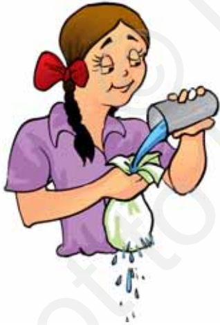
चित्र 4.2 कपड़े के गिलास का उपयोग करते हुए

क्या आपने कभी यह जानने का प्रयास किया है कि गिलास कपड़े का क्यों नहीं बनाया जाता? अध्याय 3 में कपड़े के टुकड़ों के साथ जो प्रयोग हमने किया था उसे याद कीजिए और यह ध्यान में रखिए कि हम गिलास का उपयोग सामान्यतः द्रवों को रखने के लिए करते हैं। इसलिए अब यदि हम कपड़े का गिलास बनाएँ तो क्या हमारा यह कार्य काफी हास्यास्पद प्रतीत नहीं होगा (चित्र 4.2)। गिलास बनाने के लिए हमें काँच, प्लास्टिक, धातु अथवा कोई ऐसा पदार्थ