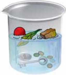
चित्र 4.6 जल में डूबती तथा तैरती वस्तुएँ

आकर तैरने लगे थे। अन्य डूबकर गिलास की तली में पहुँच गए थे, क्या यह सही नहीं है? हम ऐसे बहुत-से उदाहरण देखते हैं, जिनमें पदार्थ जल में तैरते रहते हैं अथवा डूब जाते हैं (चित्र 4.6)। किसी तालाब की सतह पर गिरी सूखी पत्तियाँ, वह कंकड़ जो आप इसी तालाब में फेंक देते हैं, शहद की कुछ बूंदें जिन्हें आप गिलास के जल में डालते हैं, इन सबका क्या होता है?