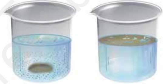
चित्र 4.4 क्या लुप्त होता है और क्या नहीं?

कुछ ठोस पदार्थों जैसे चीनी, नमक, चाक पाउडर, बालू (रेत) तथा लकड़ी के बुरादे के नमूने एकत्र कीजिए। काँच के पाँच गिलास लीजिए। प्रत्येक गिलास के लगभग 2/3 भाग में जल भरिए। पहले गिलास में कुछ मात्रा में (चम्मच भरकर) चीनी, दूसरे में नमक तथा इसी प्रकार शेष गिलासों में अन्य पदार्थ मिलाइए। प्रत्येक गिलास की अंतर्वस्तु को चम्मच से विलोडित कीजिए (धीरे-धीरे हिलाइए)। कुछ मिनट तक प्रतीक्षा कीजिए। प्रेक्षण कीजिए और पता लगाइए कि जल में मिलाए गए पदार्थों का क्या होता है (चित्र 4.4)। अपने प्रेक्षणों को सारणी 4.3 में दर्शाए अनुसार नोट कीजिए।