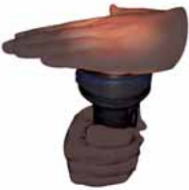
चित्र 4.9 क्या टॉर्च का प्रकाश आपकी हथेली से गुजरता है

अतः हम पदार्थों को अपारदर्शी, पारदर्शी तथा पारभासी के रूप में समूहों में बाँट सकते हैं।