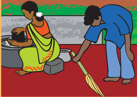
वेणु का परिवार