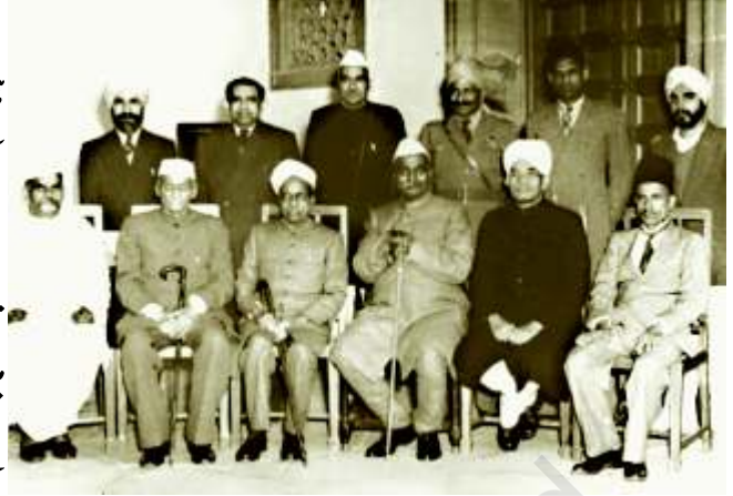
ہندوستان کے آئین کو لکھنے والے کچھ اراکین

حالانکہ یہ اعلیٰ مقاصد ہمارے آئین میں محفوظ ہیں، تاہم عدم مساوات آج بھی پائی جاتی ہے جیسا کہ اس باب میں بیان کیا گیا ہے۔ مساوات یا برابری ایسی قدر ہے جس کے لیے ہمیں جدوجہد اور کوشش جاری رکھنی ہوگی۔ یہ ایسی چیز نہیں ہے جو خود بخود آجائے گی۔ لوگوں کی جدوجہد اور حکومت کی جانب سے مثبت عملی کام اسے تمام ہندوستانیوں کے لیے ایک حقیقت بنانے کے واسطے ضروری ہیں۔