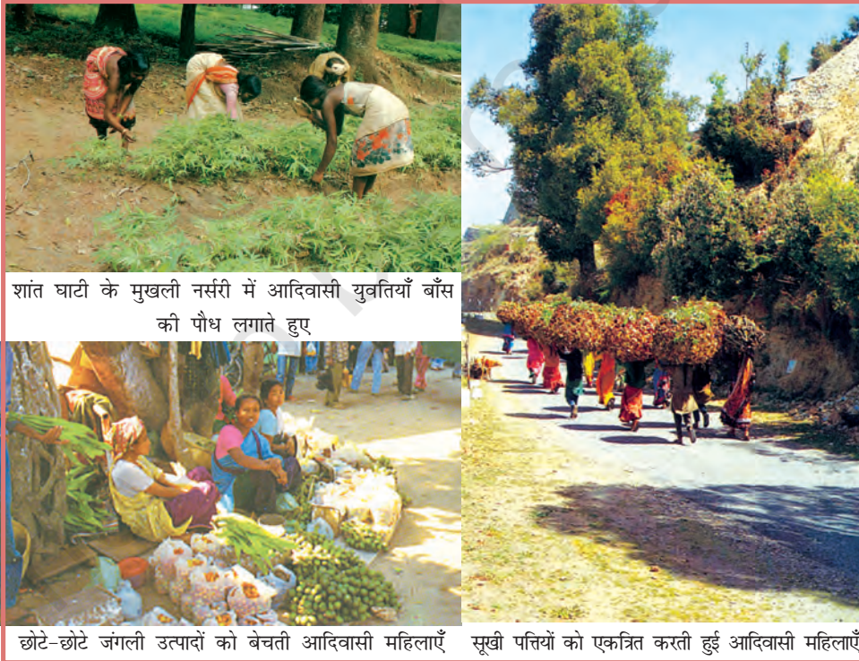
शांत घाटी के मुखली नर्सरी में आदिवासी युवतियाँ बाँस की पौध लगाते हुए

भारत में जैव-विविधता को कम करने वाले कारकों में वन्य जीव के आवास का विनाश, जंगली जानवरों को मारना व आखेटन, पर्यावरणीय प्रदूषण व विषाक्तिकरण और दावानल आदि शामिल हैं। पर्यावरण विनाश के अन्य मुख्य कारकों में संसाधनों का असमान बंटवारा व उनका असमान उपभोग और पर्यावरण के रख-रखाव की जिम्मेदारी में असमानता शामिल हैं। आमतौर पर विकासशील देशों में पर्यावरण विनाश का मुख्य दोषी अत्यधिक जनसंख्या को माना जाता है। यद्यपि एक अमेरिकी नागरिक का औसत संसाधन उपभोग एक सोमाली नागरिक के औसत उपभोग से 40 गुणा ज्यादा है। इसी प्रकार शायद भारत के 5 प्रतिशत धनी लोग 25