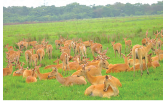
चित्र 2.4 – कांजीरंगा राष्ट्रीय उद्यान में गैंडा और हिरन

एशियाई शेर, और अन्य प्राणी शामिल हैं। इसके अतिरिक्त, कुछ समय पहले भारतीय हाथी, काला हिरण, चिंकारा, भारतीय गोडावन (bustard) और हिम तेंदुओं आदि के शिकार और व्यापार पर संपूर्ण अथवा आंशिक प्रतिबंध लगाकर कानूनी रक्षण दिया है।