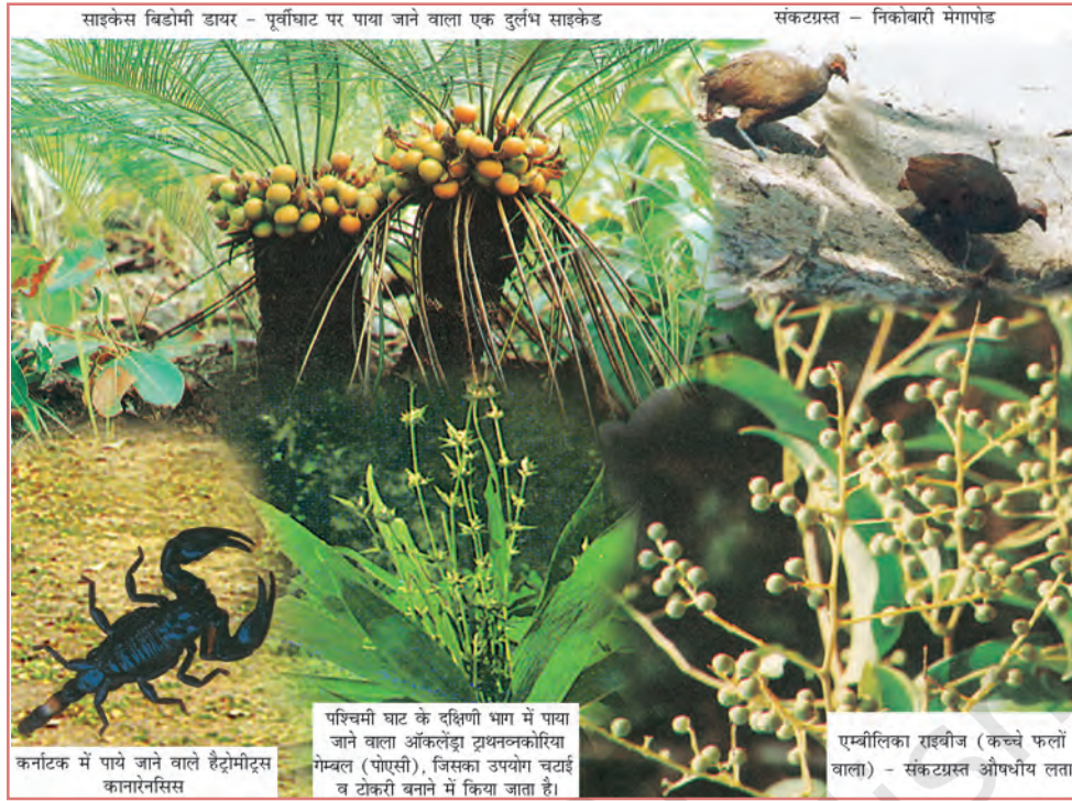
चित्र 2.2 - कुछ लुप्त, दुर्लभ तथा संकटग्रस्त जातियाँ

दिया है। हमें लकड़ी, छाल, पत्ते, रबड़, दवाइयाँ, भोजन, ईंधन, चारा, खाद इत्यादि प्रत्यक्ष अथवा परोक्ष रूप से वनों और वन्य जीवन से प्राप्त होता है इसलिए हम ही हैं जिन्होंने वन और वन्यजीवन को नुकसान पहुँचाया है। भारत में वनों को सबसे बड़ा नुकसान उपनिवेश काल में रेललाइन, कृषि, व्यवसाय, वाणिज्य वानिकी और खनन क्रियाओं में वृद्धि से हुआ। स्वतंत्रता प्राप्ति के बाद भी वन संसाधनों के सिकुड़ने से कृषि का फैलाव महत्वपूर्ण कारकों में से एक रहा है। भारत में वन सर्वेक्षण के अनुसार 1951 और 1980 के बीच लगभग 26,200 वर्ग किमी. वन क्षेत्र कृषि भूमि में परिवर्तित किया गया। अधिकतर जनजातीय क्षेत्रों, विशेषकर पूर्वोत्तर और मध्य भारत में स्थानांतरी (झूम) खेती अथवा 'स्लैश और बर्न' खेती के चलते वनों की कटाई या निम्नीकरण हुआ है।