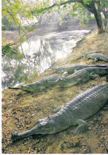
CRITICALLY ENDANGERED: Captive gharial at the Madras C

W ISPY tendrils of mist rise delicately from the water surface, tinged gold by the dawn. Your breath hangs as little clouds of vapour as you gaze upon the Girwa River on a cold winter morning. A trio of hollow clapping sounds from the other side of the river, half a kilometre away tells you that an adult male gharial is advertising his presence. It is the height of the breeding season. The place seems trapped in a time in early history when man was still clad in animal skins. It is only as the sun rises higher and burns the mist off the water that the world comes into focus with appalling clarity. The five-km stretch of the Girwa River in Katarniaghat Wildlife Sanctuary is one of the only three wild breeding sites left in the world for the most unique of all the