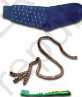
चित्र 3.3 : नाइलॉन से निर्मित विभिन्न वस्तुएँ।

हम नाइलॉन से निर्मित कई वस्तुओं को उपयोग में लाते हैं, जैसे— जुराबें, रस्से, तम्बू, दाँत साफ़ करने का ब्रुश, कारों की सीट के पट्टे, स्लीपिंग बैग (शयन थैला), परदे, आदि (चित्र 3.3)। नाइलॉन का उपयोग पैराशूट