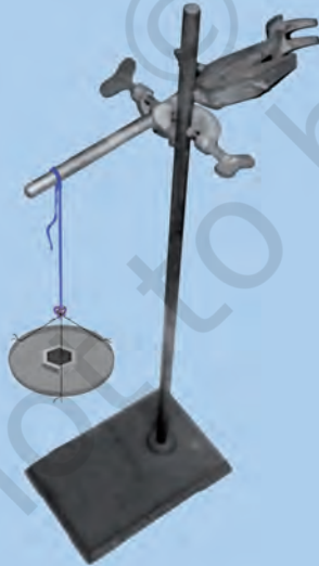
चित्र 3.5 : एक लोहे के स्टैंड पर क्लैम्प से लटकता हुआ एक धागा।

एक क्लैम्प युक्त लोहे का स्टैंड लीजिए। लगभग 60 सेमी लम्बा एक सूती धागा लीजिए। इसे क्लैम्प से बाँध दीजिए जिससे यह स्वतंत्र रूप से लटक जाए, जैसा चित्र 3.5 में प्रदर्शित है। मुक्त सिरे पर