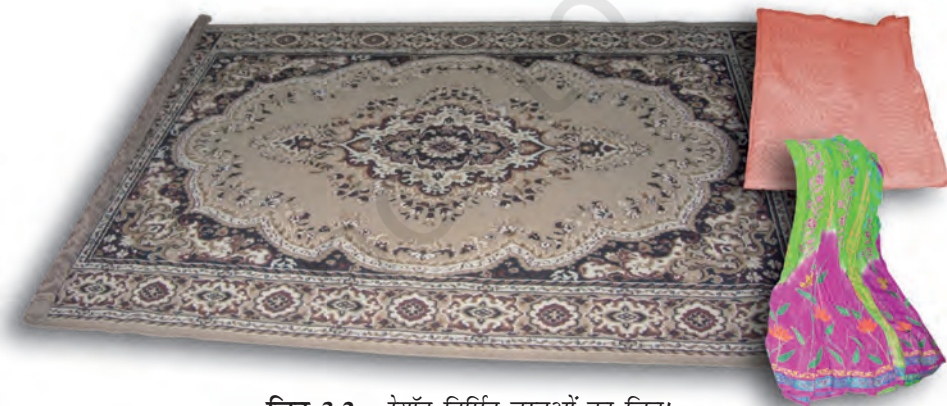
चित्र 3.2 : रेयॉन निर्मित वस्तुओं का चित्र।

आपने कक्षा VII में पढ़ा है कि रेशम कीट से प्राप्त किया जाता है। इसकी खोज चीन में हुई थी और इसे लम्बे समय तक कड़ी सुरक्षा में गोपनीय रखा गया। रेशम रेशे से प्राप्त कपड़ा बहुत मँहगा होता है परन्तु इसकी सुन्दर बुनावट (texture) ने प्रत्येक व्यक्ति को मोह लिया। रेशम को कृत्रिम रूप से बनाने के प्रयास किये गए। उन्नीसवीं शताब्दी के अन्तिम छोर पर वैज्ञानिकों को रेशम समान गुणों वाले रेशे प्राप्त करने में सफलता प्राप्त हुई। इस प्रकार का रेशा काष्ठ लुगदी के रासायनिक उपचार से प्राप्त किया गया। यह रेशा रेयॉन अथवा कृत्रिम रेशम कहलाया। यद्यपि रेयॉन प्राकृतिक स्रोत काष्ठ लुगदी से प्राप्त किया जाता है, यह एक मानव निर्मित रेशा है। यह रेशम से सस्ता होता है परन्तु इसे रेशम रेशों के समान बुना जा सकता है। इसे रंगों की कई किस्मों में रँगा जा सकता है। रेयॉन को कपास के साथ मिलाकर बिस्तर की चादरें बनाते हैं अथवा ऊन के साथ मिलाकर कालीन या गलीचा बनाते हैं। (चित्र 3.2)।