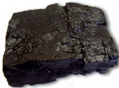
चित्र 5.1 : कोयला।

आपने कोयला देखा होगा या इसके बारे में सुना होगा (चित्र 5.1)। यह पत्थर जैसा कठोर और काले रंग का होता है।