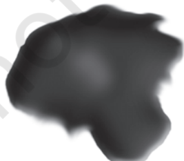
चित्र 5.3 : कोलतार।

यह एक अप्रिय गंध वाला काला गाढ़ा द्रव होता है (चित्र 5.3)। यह लगभग 200 पदार्थों का मिश्रण