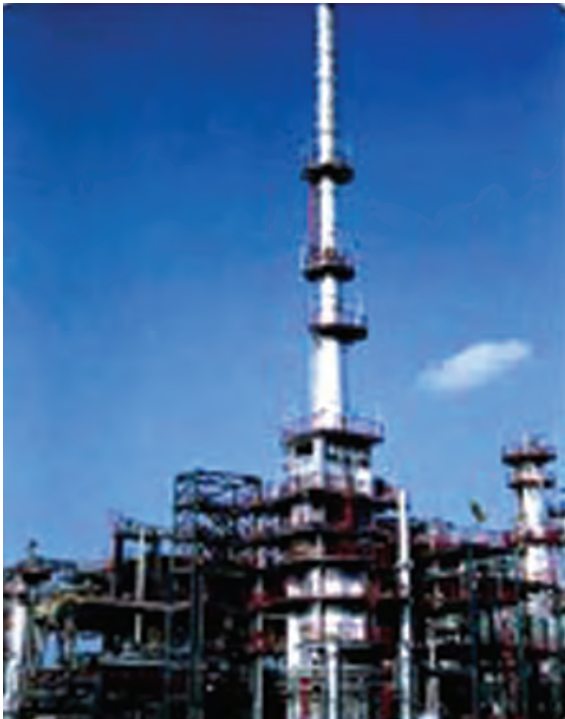
चित्र 5.5 : पेट्रोलियम परिष्करण।

को पृथक करने का प्रक्रम परिष्करण कहलाता है। यह कार्य पेट्रोलियम परिष्करण में सम्पादित किया जाता है (चित्र 5.5)।