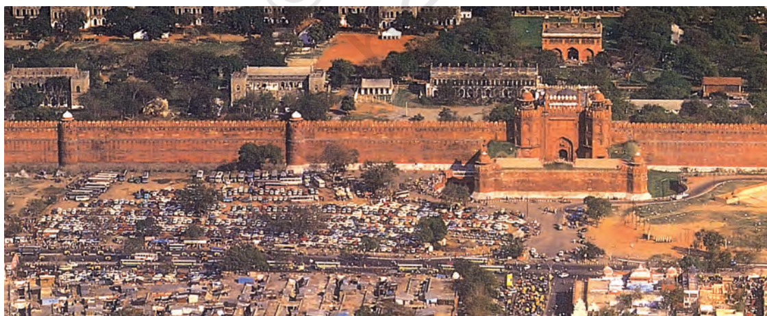
लाल किला (दिल्ली)

यदि अकबर ने इस तरफ़ ध्यान दिया होता और पता लगाया होता कि संसार के दूसरे हिस्सों में क्या हो रहा है तो उसने सामाजिक परिवर्तन की