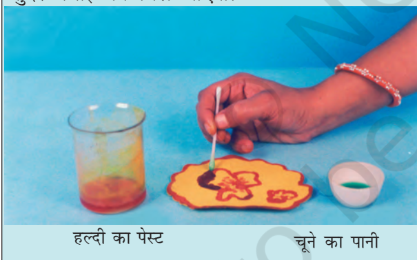
हल्दी का पेस्ट

आप अपनी माताजी के जन्मदिन पर, उनके लिए विशेष बधाई पत्र बना सकते हैं। सादे सफेद कागज़ की शीट पर हल्दी का पेस्ट लगाइए और उसे सुखा लीजिए। रुई के फाहे की सहायता से इस पर चूने के पानी से एक खूबसूरत फूल बनाइए। आपको एक सुंदर बधाई पत्र मिल जाएगा।