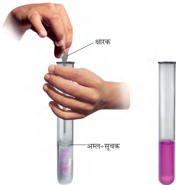
चित्र 5.4 उदासीनीकरण का प्रक्रम

(चित्र 5.4)। परखनली को धीरे-धीरे हिलाइए। क्या आपको अम्ल के रंग में कोई परिवर्तन दिखाई देता है?