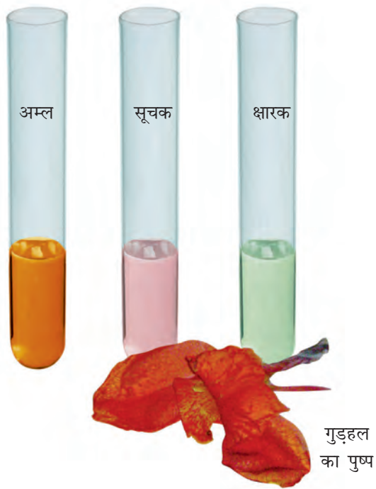
चित्र 5.3 गुड़हल का पुष्प और उससे तैयार किया गया सूचक

आप इन प्राकृतिक सूचकों को बनाकर उनसे अम्लीय, क्षारकीय और उदासीन विलयनों में रंग परिवर्तन देखने का प्रयास कर सकते हैं।