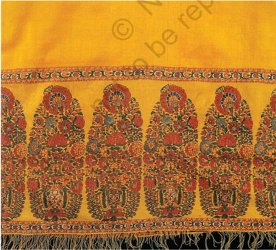
चित्र 5 शॉल का बॉर्डर