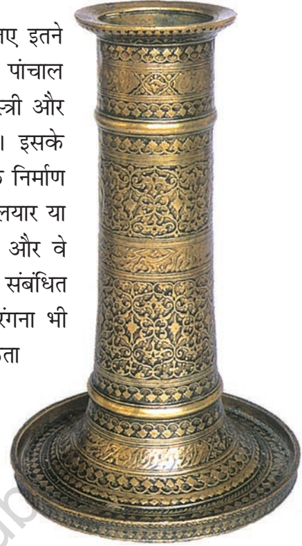
चित्र 4 पीतल के इस मोमबत्तीदान पर काला आवरण है।

बीदर के शिल्पकार ताँबे तथा चाँदी में जड़ाई के काम के लिए इतने अधिक प्रसिद्ध थे कि इस शिल्प का नाम ही 'बीदरी' पड़ गया। पांचाल अर्थात् विश्वकर्मा समुदाय जिसमें सुनार, कसेरे, लोहार, राजमिस्त्री और बढई शामिल थे; मंदिरों के निर्माण के लिए आवश्यक थे। इसके अलावा वे राजमहलों, बड़े-बड़े भवनों, तालाबों और जलाशयों के निर्माण में भी अपनी महत्वपूर्ण भूमिका अदा करते थे। इसी प्रकार सालियार या कैक्कोलार जैसे बुनकर भी समृद्धिशाली समुदाय बन गए थे और वे मंदिरों को भारी दान-दक्षिणा दिया करते थे। वस्त्र-निर्माण से संबंधित कुछ अन्य कार्य, जैसे-कपास को साफ़ करना, कातना और रंगना भी स्वतंत्र व्यवसाय बन गए थे, जिनके लिए विशेषज्ञता की आवश्यकता होती थी।