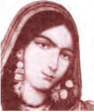
बेगम हज़रत महल

गया। कई महीनों तक उत्तरी और मध्य भारत के विस्तृत भूभाग पर विद्रोहियों का कब्ज़ा रहा।