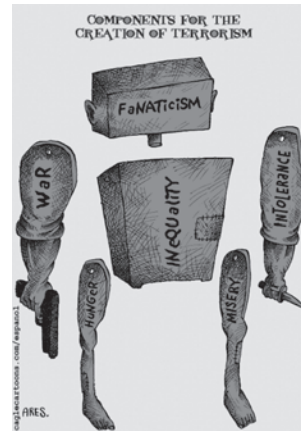
आतंकवाद के जन्म के कारण

संयुक्त राष्ट्र शैक्षणिक, वैज्ञानिक एवं सांस्कृतिक संगठन (यूनिसेफ) के संविधान ने उचित ही टिप्पणी की है कि, “चूँकि युद्ध का आरंभ