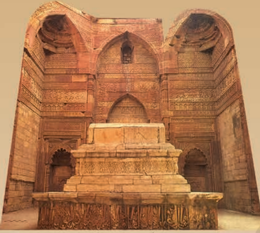
اتمش کا مقبرہ