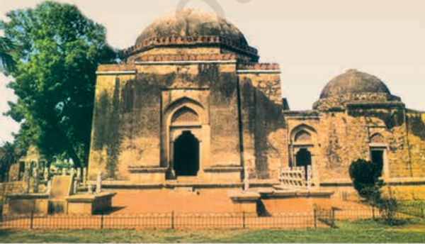
فیروز شاہ تغلق کا مقبرہ