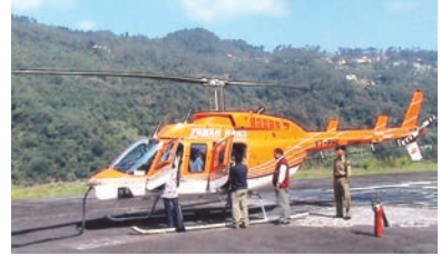
شکل 7.9: ہیلی کاپٹر

بیسویں صدی کے اوائل میں اس تیز رفتار آمدورفت کے ذریعہ کی توسیع و ترقی ہوئی۔ ایندھن کی زیادہ قیمت ہونے کی وجہ سے آمدورفت کا یہ سب سے مہنگا ذریعہ ہے۔ فضائی ٹریفک موسم سے بہت زیادہ متاثر ہوتا ہے، جیسے کہ کھرب اور طوفان وغیرہ۔ یہ آمدورفت اور نقل و حمل کا اکیلا ایسا ذریعہ ہے جو دوردراز و دور افتادہ علاقوں تک پہنچ سکتا ہے، خصوصاً ان علاقوں تک جہاں ریل اور سڑکیں نہیں ہیں۔ ہیلی کاپٹروں کا استعمال دور افتادہ علاقوں اور قدرتی آفات و ہنگامی حالات میں لوگوں کی جان بچانے ان تک پانی، غذا، کپڑے اور دوائیں تقسیم کرنے کے لیے کیا جاتا ہے۔ (شکل 7.9) چند اہم ہوائی اڈے: دہلی، ممبئی، نیویارک، لندن، پیرس، فرینکفرٹ اور قاہرہ ہیں۔ (شکل 7.11)