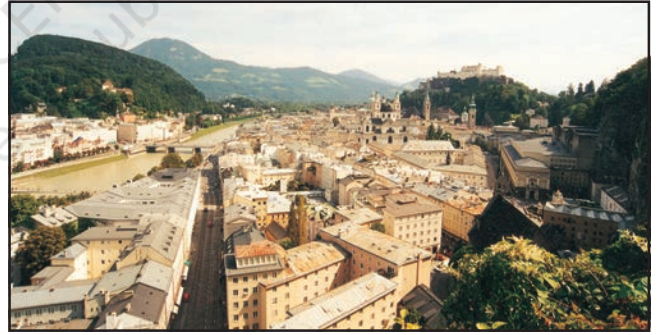
شکل 7.2: گھنی بستی

Rural)۔ دیہاتی بستیاں (Rural Settlement) وہ بستیاں ہیں جہاں کے رہنے والے لوگ زراعت، ماہی گیری، مچھلی پالنے، جنگل بانی، دستکاری اور مویشی پالنے وغیرہ پیشوں سے جڑے ہوئے ہیں۔ گاؤں یا دیہات کی بستیاں گھنی (قریب ملی ہوئی) یعنی گنجان اور چھدری یا پھیلی اور گنجان دونوں قسم کی ہوتی ہیں۔ گھنی بستیوں میں مکان بہت قریب قریب گھنے بسے ہوئے ہوتے ہیں۔ (شکل 7.2)