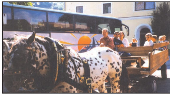
شکل 7.5 گھوڑا گاڑی نقل و حمل کا ایک ذریعہ

یہ لوگوں اور سامان کے ایک جگہ سے دوسری جگہ منتقل ہونے کے ذرائع ہیں۔ پرانے زمانے میں طویل سفر کرنے میں بہت وقت لگتا تھا۔ لوگوں کو پیدل سفر کرنا ہوتا تھا اور سامان ڈھونے کے لیے جانوروں کی ضرورت ہوتی تھی۔ پہیہ کی ایجاد نے نقل و حمل کو بہت آسان بنا دیا۔ وقت کے ساتھ نقل و حمل کے مختلف ذرائع ایجاد ہوئے جن میں لگاتار ترقی ہو رہی ہے لیکن لوگ آج بھی نقل و حمل کے لیے جانوروں کا استعمال کرتے ہیں۔ (شکل 7.5)