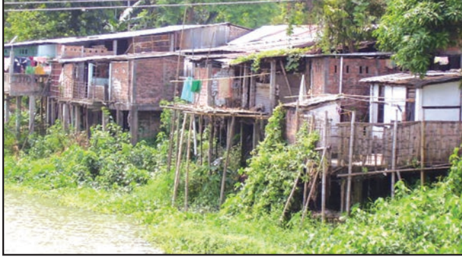
شکل 7.4: بانس کے سہاروں پر بنے مکانات