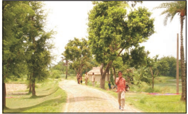
شکل 7.7: کچی سڑک