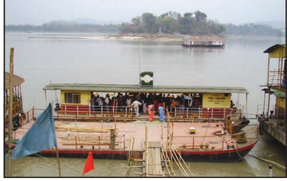
شکل 7.8 بین الاقوامی راستے

جسامت کے سامان کو دوردراز کے مقامات تک آسانی پہنچایا جاسکتا ہے۔ آبی ذرائع دو قسم کے ہوتے ہیں۔ اندرون ملک آبی راستے (Inland Water Ways) اور بحری راستے (Searoutes)