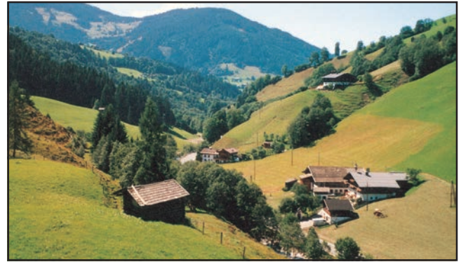
شکل 7.3: چھدری یا پھیلی ہوئی بستی