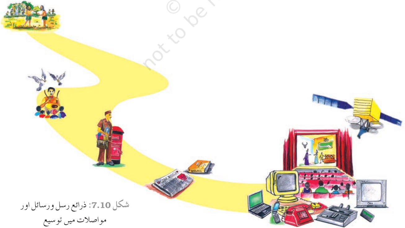
شکل 7.10: ذرائع رسل و رسائل اور مواصلات میں توسیع

مواصلات کے میدان میں توسیع و ترقی ہونے سے معلوماتی انقلاب آ گیا ہے۔ معلومات فراہم کرنے کے لیے مختلف قسم کے ذرائع مواصلات استعمال کیے جا رہے ہیں تاکہ لوگوں کے اندر تعلیم اور بیداری پیدا کی جاسکے ساتھ ہی لوگوں کے لیے تفریح و کھیل کا سامان بھی مہیا کیا جاسکے۔ اخبار، ریڈیو اور ٹیلی ویژن کے ذریعہ ہم بہت سارے لوگوں سے رابطہ قائم کر سکتے ہیں۔ اسی لیے اس کو لوگوں تک پہنچنے کا راستہ یا لوگوں کو جوڑنے کا راستہ (Mass Media) کہا جاتا ہے۔ سیٹلائٹ کے ذریعہ بھی مواصلات میں تیز رفتاری آئی ہے۔ معدنی تیل کی تلاش، جنگلات کا تحفظ، زیر زمین پانی، معدنی دولت، موسم کی پیشین گوئی اور قدرتی آفات جیسے ناگہانی حالات وغیرہ کی پیشگی اطلاع میں سیٹلائٹ مددگار ہوتے ہیں۔ اب ہم انٹرنیٹ کی وساطت سے الیکٹرانک میل (برقی ڈاک/E-Mail) بھیج سکتے ہیں۔ آج سیلیولر فون کے ذریعہ بغیر تار کے ٹیلی فون مواصلات بہت مقبول ہو چکے ہیں۔ انٹرنیٹ کے توسط سے دنیا بھر میں صرف اطلاعات اور آپسی تعلقات اور نزدیکی ہی نہیں بڑھی ہے بلکہ اس سے ہماری زندگی آسودہ اور آسان بھی ہو گئی ہے۔ اب ہم گھر بیٹھے ریل، ہوائی جہاز، ہوٹلوں، سنیما گھروں کے ٹکٹ محفوظ کر سکتے ہیں۔ اس طرح لوگوں کے درمیان، سہولیات اور شعبوں کے درمیان تیز رفتاری سے بالواسطہ رابطہ قائم ہونے کی وجہ سے آج ہم ایک آفاقی سماج کی شکل میں ابھر رہے ہیں۔