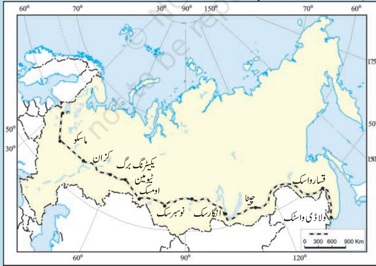
ٹرانس سائبیریا ریلوے

ٹرانس سائبیریا ریلوے دنیا کی سب سے لمبی ریلوے لائن کا نظام ہے جو مغربی روس میں سینٹ پیٹرس برگ کو بحر الکاہل کے ساحل پر واقع مقام ولاڈی واسٹک کو جوڑتا ہے۔