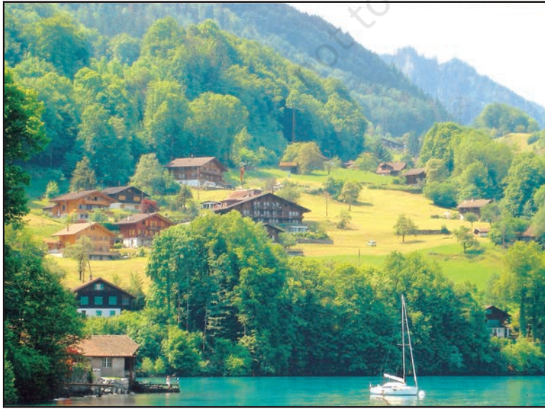
شکل 7.1 انسانی بستی

بستیاں مستقل اور غیر مستقل ہو سکتی ہیں۔ وہ بستیاں جو ایک قلیل مدت کے لیے بسائی جاتی ہیں غیر مستقل بستیاں کہلاتی ہیں۔ گھنے جنگلات، گرم و سرد ریگستانوں اور پہاڑوں پر رہنے والے لوگ اکثر غیر مستقل بستیاں بساتے ہیں۔ وہ شکار، لکڑی وغیرہ اکٹھا کرنے، انتقالی کاشت کاری اور موسمی نقل مکانی یا ہجرت وطن کرتے ہیں۔ لیکن آج کل زیادہ تر بستیاں مستقل ہیں۔ ان بستیوں میں لوگ اپنے مکان بناتے ہیں۔