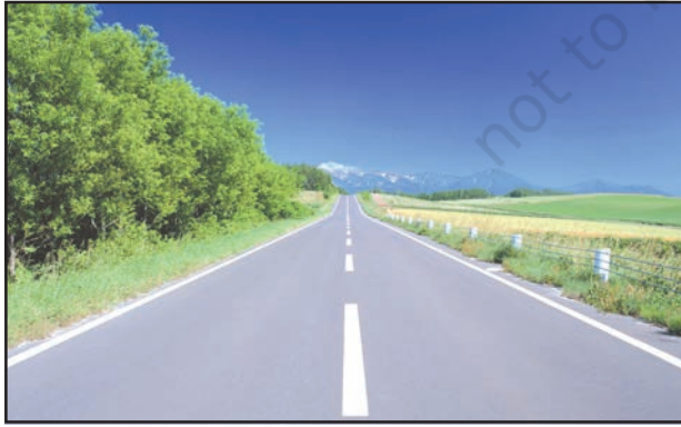
شکل 7.6: پکی سڑک

کم فاصلہ طے کرنے کے لیے سب سے زیادہ استعمال میں آنے والا آمدورفت کا ذریعہ شاہراہ/سڑک ہے۔ سڑکیں کچی اور پکی ہو سکتی ہیں (تصویر 7.6 اور 7.7) میدانی علاقوں میں سڑکوں کا گھنا جال بچھا ہوا ہے۔ ریگستانی علاقوں جنگلوں اور بلند پہاڑوں پر بھی سڑکیں بنی ہوئی ہیں۔ ہمالیہ پہاڑ پر 'منالی' شاہراہ دنیا کی سب سے اونچے علاقے میں بنی سڑک ہے۔ زمین دوز سڑکوں کو 'زمین دوز شاہراہ' (Subway) کہتے ہیں جب کہ فلائی اور (Fly Over) اونچے پل بنا کر تعمیر کیے جاتے ہیں۔