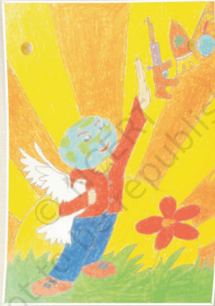
ایس. امال جیری، 10 سال سینٹ پیٹرک ماڈرن ہائیر سیکنڈری اسکول، پانڈیچری