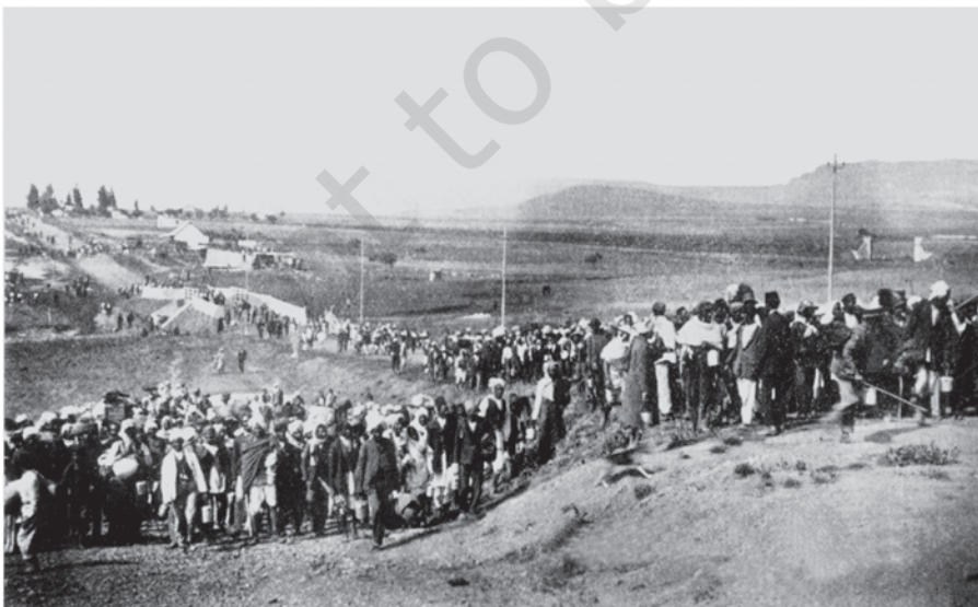
चित्र 2 - दक्षिण अफ़्रीका में भारतीय मज़दूर फ़ोकस्वस्ट से गुज़र रहे हैं,

महात्मा गांधी जनवरी 1915 में भारत लौटे। इससे पहले वे दक्षिण अफ़्रीका में थे। उन्होंने एक नए तरह के जनांदोलन के रास्ते पर चलते हुए वहाँ की