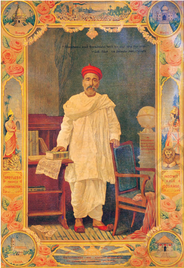
चित्र 11 - बालगंगाधर तिलक, बीसवीं सदी के शुरू की तसवीर।

ध्यान से देखें कि तिलक एकता के प्रतीकों से घिरे हुए हैं। चित्र के चारों ओर विभिन्न धर्मों के पवित्र स्थान (मंदिर, चर्च, मस्जिद) चित्रित किए गए हैं।