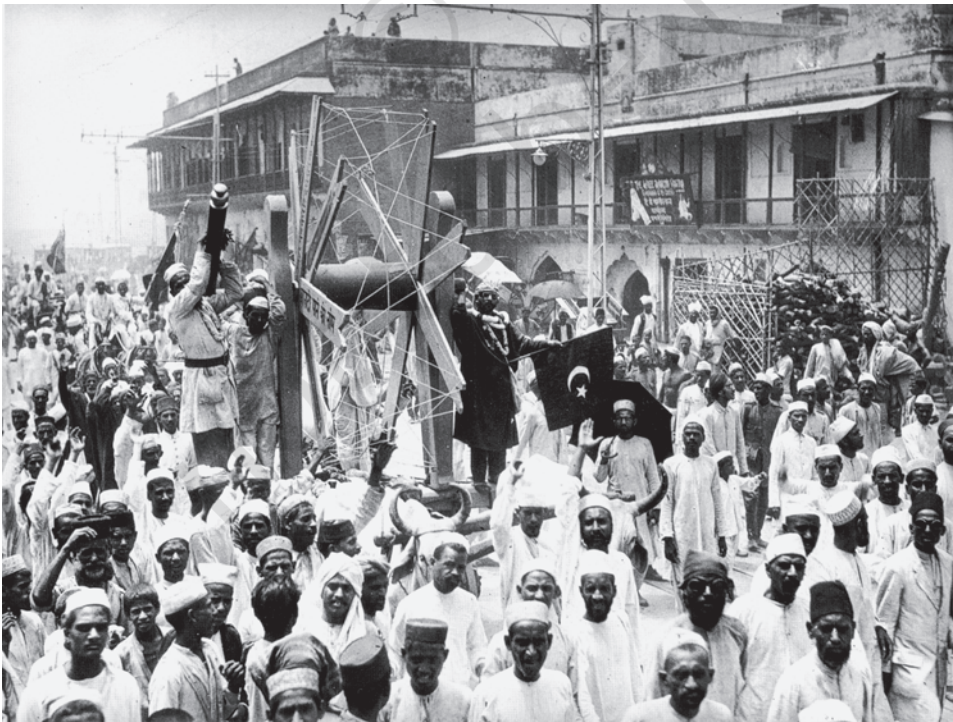
चित्र 4 - विदेशी कपड़े का बहिष्कार, जुलाई 1922 विदेशी कपड़ों को पश्चिमी आर्थिक एवं सांस्कृतिक प्रभुत्व का प्रतीक माना जाता था।

बहिष्कार : किसी के साथ संपर्क रखने और जुड़ने से इनकार करना या गतिविधियों में हिस्सेदारी, चीजों की खरीद व इस्तेमाल से इनकार करना। आमतौर पर यह विरोध का एक रूप होता है।