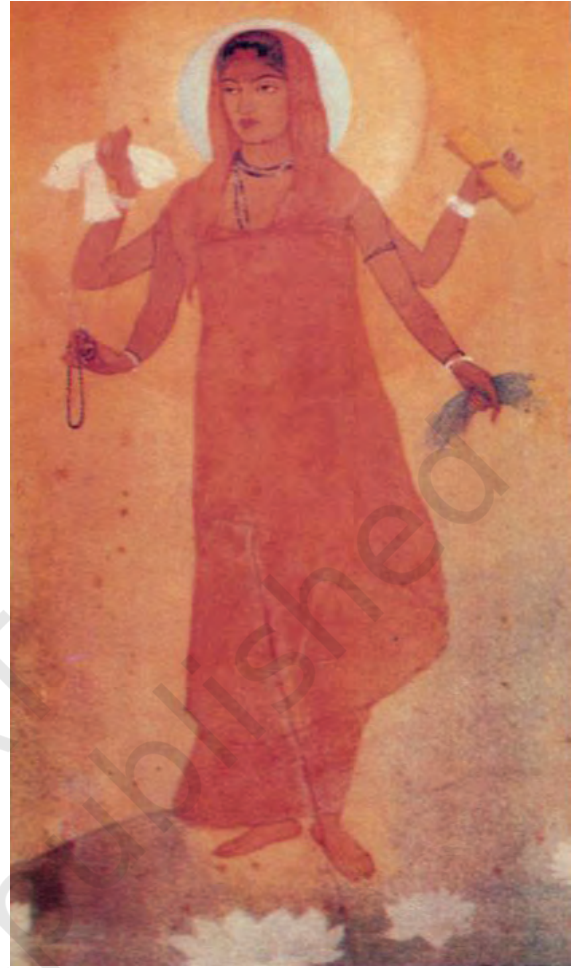
चित्र 12 - भारत माता, अबनीन्द्रनाथ टैगोर, 1905 ध्यान से देखें कि यहाँ दर्शाई गई माँ की छवि शिक्षा, भोजन और कपड़े दे रही है। एक हाथ में माला उसके संन्यासी गुण को रेखांकित करती है। अपने पूर्ववर्ती रवि वर्मा की भाँति अबनीन्द्रनाथ टैगोर ने भी ऐसी चित्र शैली विकसित करने का प्रयास किया जिसे सच्चे अर्थों में भारतीय माना जा सके।

राष्ट्रवाद का विचार भारतीय लोक कथाओं को पुनर्जीवित करने के आंदोलन से भी मजबूत हुआ। उन्नीसवीं सदी के आखिर में राष्ट्रवादियों ने भाटों व चारणों द्वारा गाई-सुनाई जाने वाली लोक कथाओं को दर्ज करना शुरू कर दिया। वे लोक गीतों व जनश्रुतियों को इकट्ठा करने के लिए गाँव-गाँव घूमने लगे। उनका मानना था कि यही कहानियाँ हमारी उस परंपरागत संस्कृति की सही तसवीर पेश करती हैं जो बाहरी ताकतों के प्रभाव से भ्रष्ट और दूषित हो चुकी है। अपनी राष्ट्रीय पहचान को दूढ़ने और अपने अतीत में गौरव का भाव पैदा करने के लिए इस लोक परंपरा को बचाकर रखना जरूरी था। बंगाल में खुद रबीन्द्रनाथ टैगोर भी लोक-गाथा गीत, बाल गीत और मिथकों