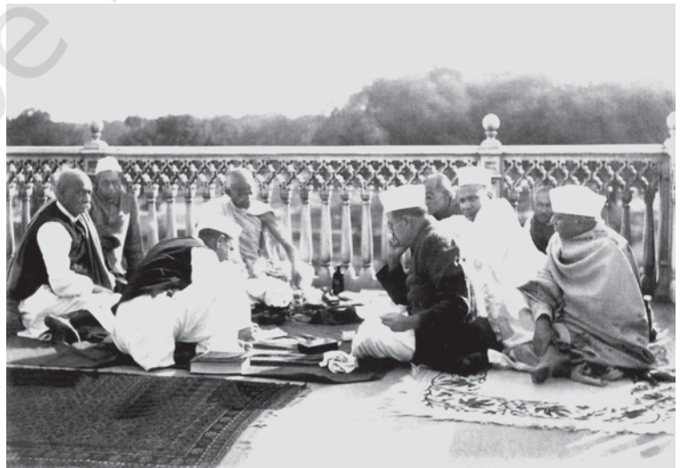
चित्र 6 - इलाहाबाद में कांग्रेस के नेताओं की बैठक, 1931

साइमन कमीशन के खिलाफ शांतिपूर्ण प्रदर्शन के दौरान ब्रिटिश पुलिस ने लाला लाजपत राय पर हमला किया। प्रदर्शन के दौरान मिले गये जख्मों के कारण उन्होंने दम तोड़ दिया।