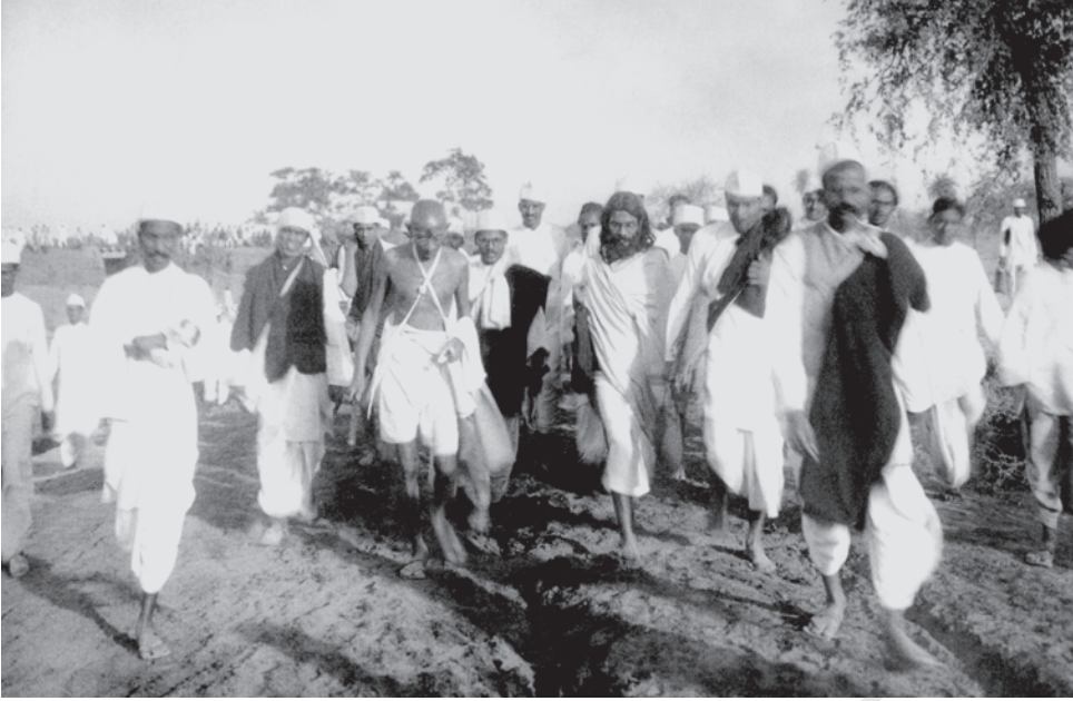
चित्र 7 - दांडी मार्च।

नमक यात्रा के दौरान महात्मा गांधी के साथ उनके 78 सहयोगी भी गए थे। रास्ते में हजारों लोग इस यात्रा में जुड़ते गए।