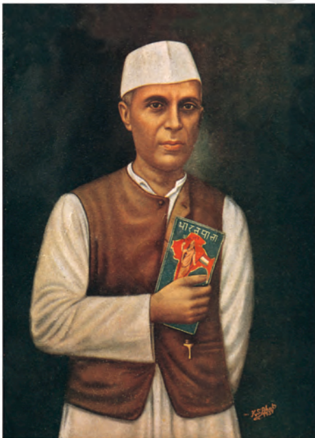
चित्र 13 - जवाहरलाल नेहरू, एक लोकप्रिय चित्र।

इस चित्र में नेहरू भारत माता और भारत के नक्शे को हृदय के पास रखे दिखाई दे रहे हैं। बहुत सारे चित्रों में राष्ट्रवादी नेताओं को अपना सिर भारत माता के चरणों में चढ़ाते हुए दर्शाया गया है। माँ के लिए बलिदान का विचार लोगों की कल्पना में बहुत महत्वपूर्ण था।