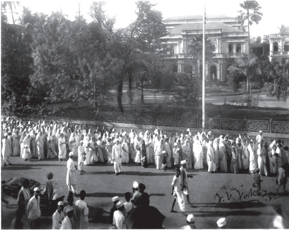
चित्र 9 - राष्ट्रवादी जुलूसों में औरतें भी शामिल थीं।

राष्ट्रीय आंदोलन के दौरान बहुत सारी औरतें अपनी जिदगी में पहली बार अपने घर से निकलकर सार्वजनिक क्षेत्र में आई थीं। इस चित्र में आप बच्चों को गोद में लिए बहुत सारी ज्यादा उम्र वाली औरतों और माँओं को भी जुलूस में देख सकते हैं।