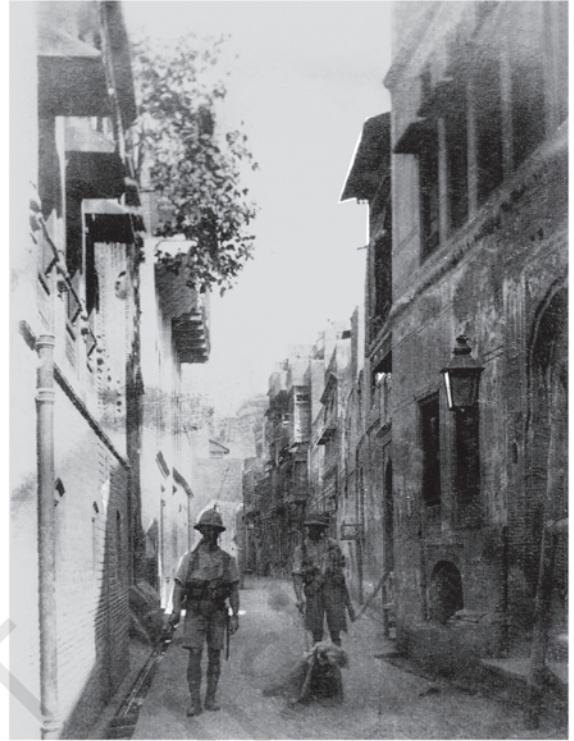
चित्र 3 - जनरल डायर के हुक्म से सिपाही लोगों को घिसट कर चलने के लिए मजबूर कर रहे हैं, पंजाब, 1919

अपनी प्रसिद्ध पुस्तक हिंद स्वराज (1909) में महात्मा गांधी ने कहा था कि भारत में ब्रिटिश शासन भारतीयों के सहयोग से ही स्थापित हुआ था और यह शासन इसी सहयोग के कारण चल पा रहा है। अगर भारत के लोग अपना सहयोग वापस ले लें तो साल भर के भीतर ब्रिटिश शासन ढह जाएगा और स्वराज की स्थापना हो जाएगी।