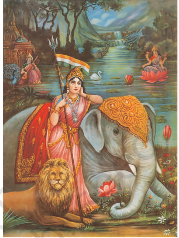
चित्र 14 - भारत माता।

लोगों को एकजुट करने की इन कोशिशों की अपनी समस्याएँ थीं। जिस अतीत का गौरवगान किया जा रहा था वह हिंदुओं का अतीत था। जिन