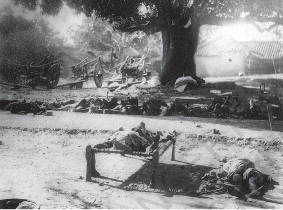
चित्र 5 - चौरा-चौरा, 1922

आदिवासियों ने गांधीजी के नाम का नारा लगाया और 'स्वतंत्र भारत' की हुंकार भरी तो वे एक अखिल भारतीय आंदोलन से भी भावनात्मक स्तर पर जुड़े हुए थे। जब वे महात्मा गांधी का नाम लेकर काम करते थे या अपने आंदोलन को कांग्रेस के आंदोलन से जोड़कर देखते थे तो वास्तव में एक ऐसे आंदोलन का अंग बन जाते थे जो उनके इलाके तक ही सीमित नहीं था।