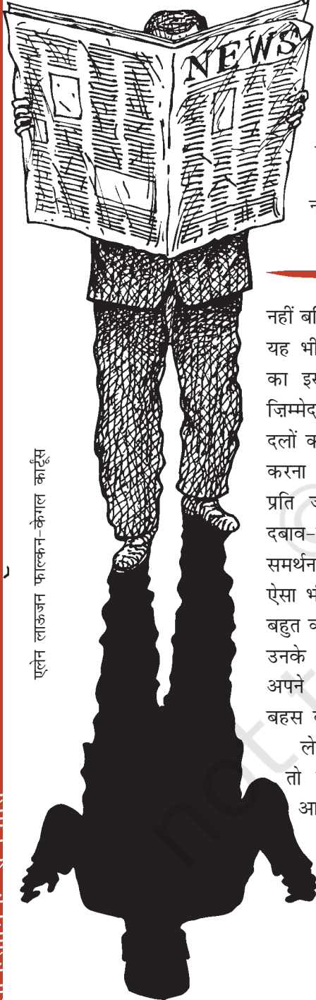
एलेन लाऊजन फाल्कन-केगल कार्टून

ऊपर के अनुच्छेद में आपको लोकतंत्र और सामाजिक आंदोलन में क्या संबंध नजर आ रहा है? इस आंदोलन को सरकार के प्रति क्या रवैया अपनाना चाहिए?