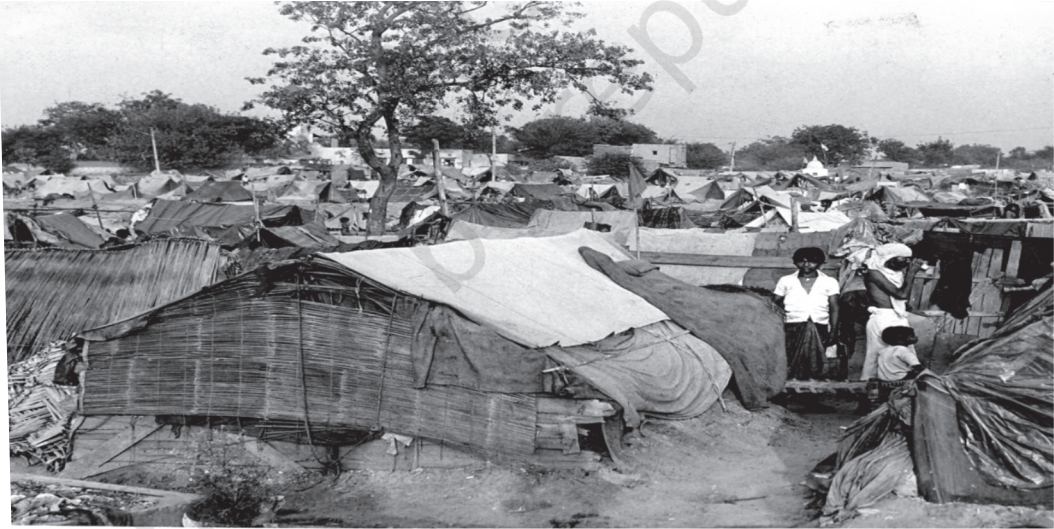
شکل 1.3 غربت، ناقص تغذیہ، صحت سے متعلق سہولتوں کا فقدان بھی آبادی کی افزائش کی دھیمی رفتار کا سبب بنا۔

کل آبادی اور نہ ہی افزائش آبادی کی شرح بہت زیادہ تھی۔ سماجی ترقی پر مختلف اشاریے (indicators) بھی کافی حوصلہ افزا نہیں تھے۔ مجموعی سطح خواندگی 16 فیصد سے بھی کم تھی۔ اس میں خواتین کی شرح خواندگی نہایت معمولی تقریباً سات فیصد تھی۔ عوامی صحت سے متعلق سہولیات یا تو آبادی کے بہت بڑے حصے کے لیے دستیاب نہیں تھیں یا اگر دستیاب بھی تھیں تو وہ انتہائی ناکافی تھیں۔ نتیجتاً پانی اور ہوا کے ذریعے پھیلنے والی بیماریاں زوروں پر تھیں اور بہت بڑے پیمانے پر ہلاکت خیزی کا سبب بنیں۔ یہ تعجب کی بات نہیں کہ مجموعی شرح اموات بہت زیادہ تھی اور اس میں بھی بچوں کی شرح اموات خیردار کرنے والی تھی۔ یعنی اس وقت بچوں کی فی ہزار شرح اموات 218 جبکہ آج یہ 33 فی ہزار ہے۔ متوقع عمر 32 برس تھی جبکہ موجودہ اوسط متوقع عمر 69 برس ہے۔ بھروسے مند اعداد و شمار نہ