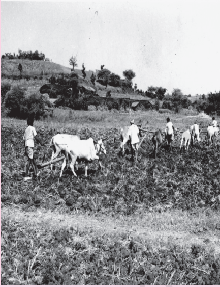
شکل 1.1 برطانوی نوآبادیاتی راج کے تحت، ہندوستان کا زراعتی جمود۔

ہندوستان میں نوآبادیاتی حکومت کے ذریعہ اختیار کی گئی معاشی پالیسیاں ہندوستانی معیشت کی ترقی کی بہ نسبت ان کے اپنے ملک کے معاشی مفاد کے تحفظ اور فروغ سے وابستہ تھیں۔ اس طرح کی پالیسیوں کے سبب ہندوستانی معیشت میں بنیادی