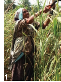
ریٹی آئی ہے۔ مگر