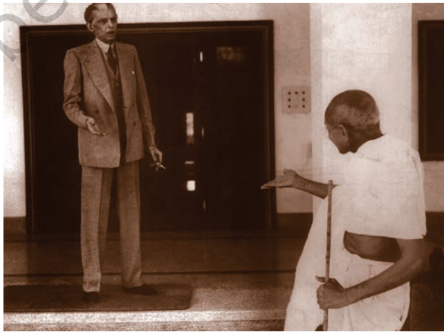
जिन्ना और गांधी

अंतर करना कठिन होता है। ज़ाहिर है कि धार्मिक दीवारें स्थायी नहीं होतीं और जो व्यक्ति अपना धर्म बदलता है उसकी जातीय पृष्ठभूमि या उसकी जातीय और भाषिक विरासत नष्ट नहीं हो जाती। परंतु राजनीतिक मामलों में, धर्म का स्थान सांप्रदायिकता ने ले लिया है। यह एक संकीर्ण समुदाय